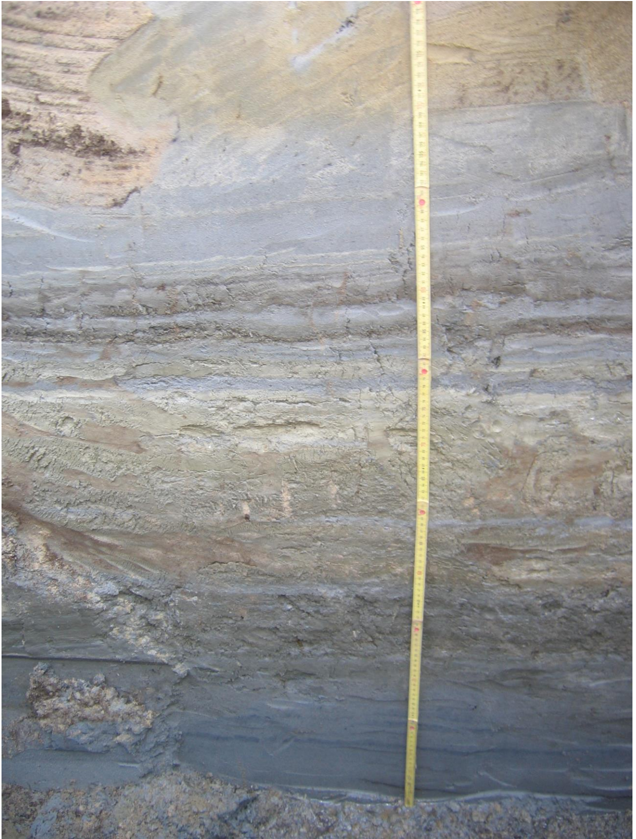
Fig. 3: Detail van het profiel