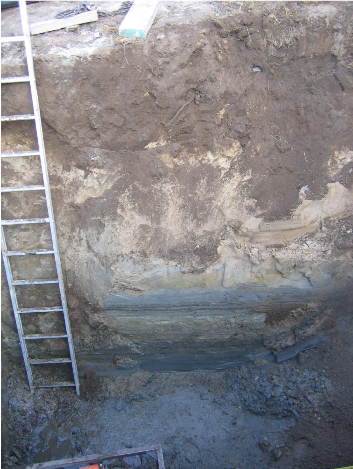
Fig. 2: Profiel van de werkput