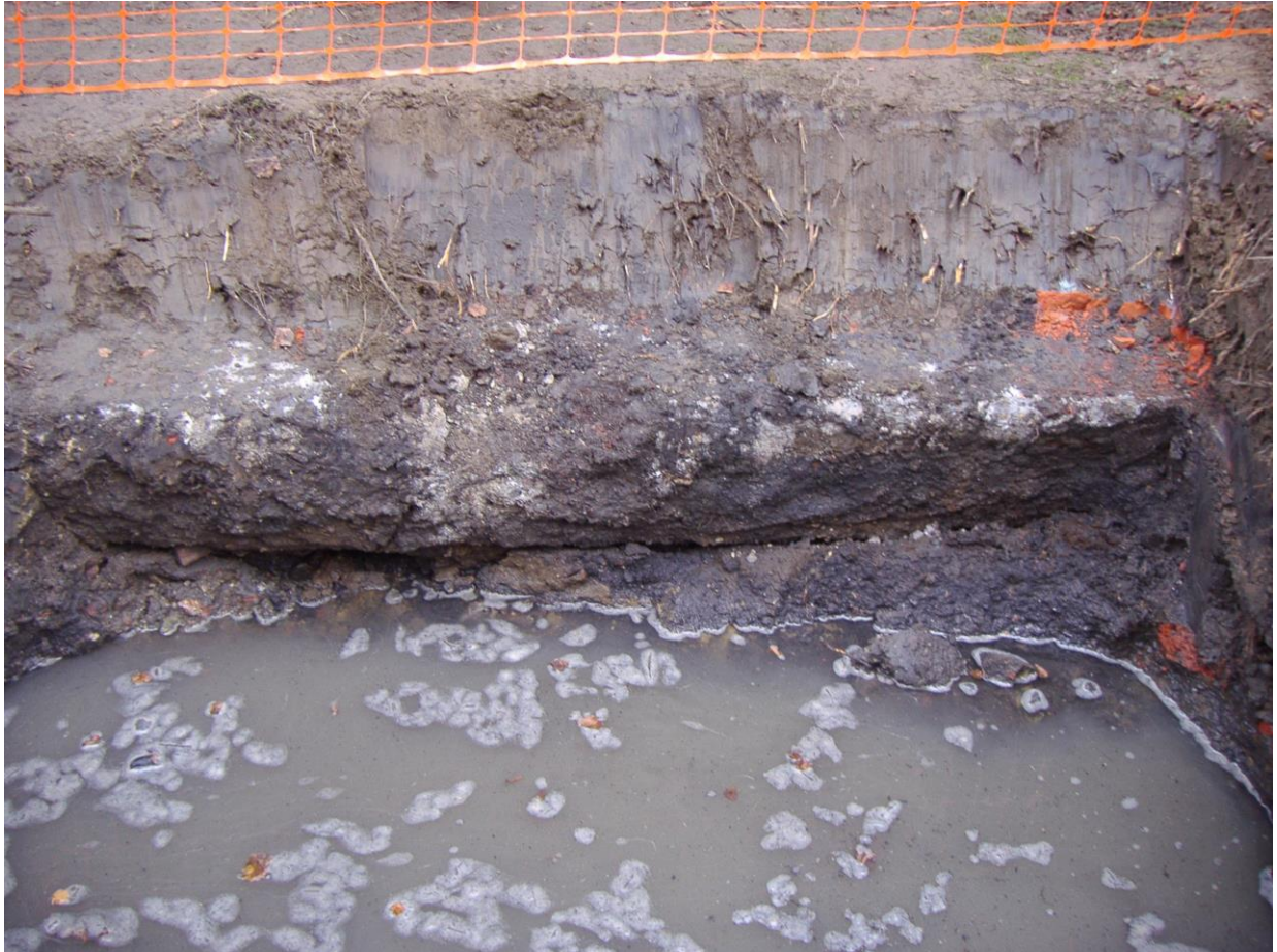
Fig. 5 Foto van de muurresten door Ann Ceulemans.