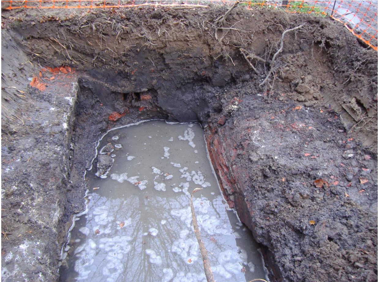
Fig. 6 Foto van de muurresten door Ann Ceulemans.