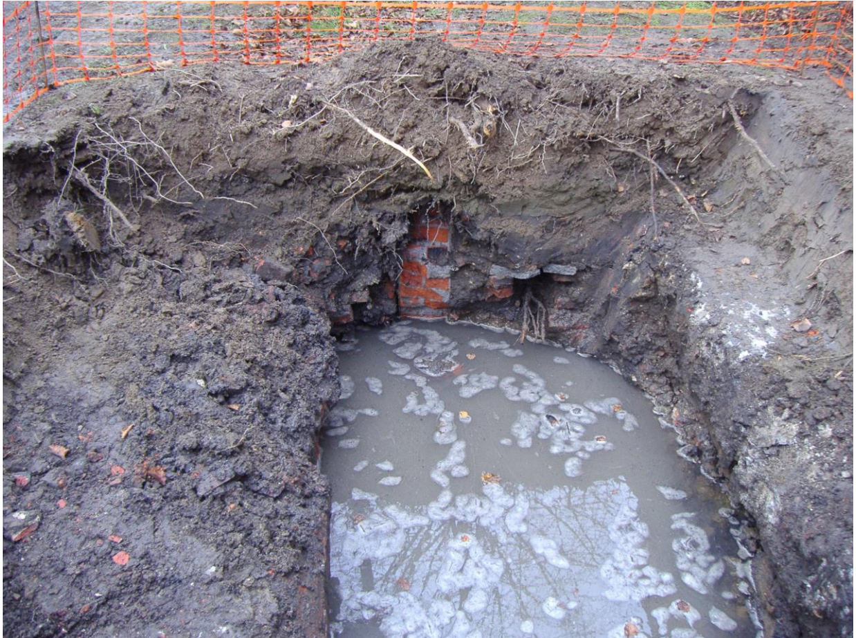
Fig. 4 Foto van de muurresten door Ann Ceulemans.