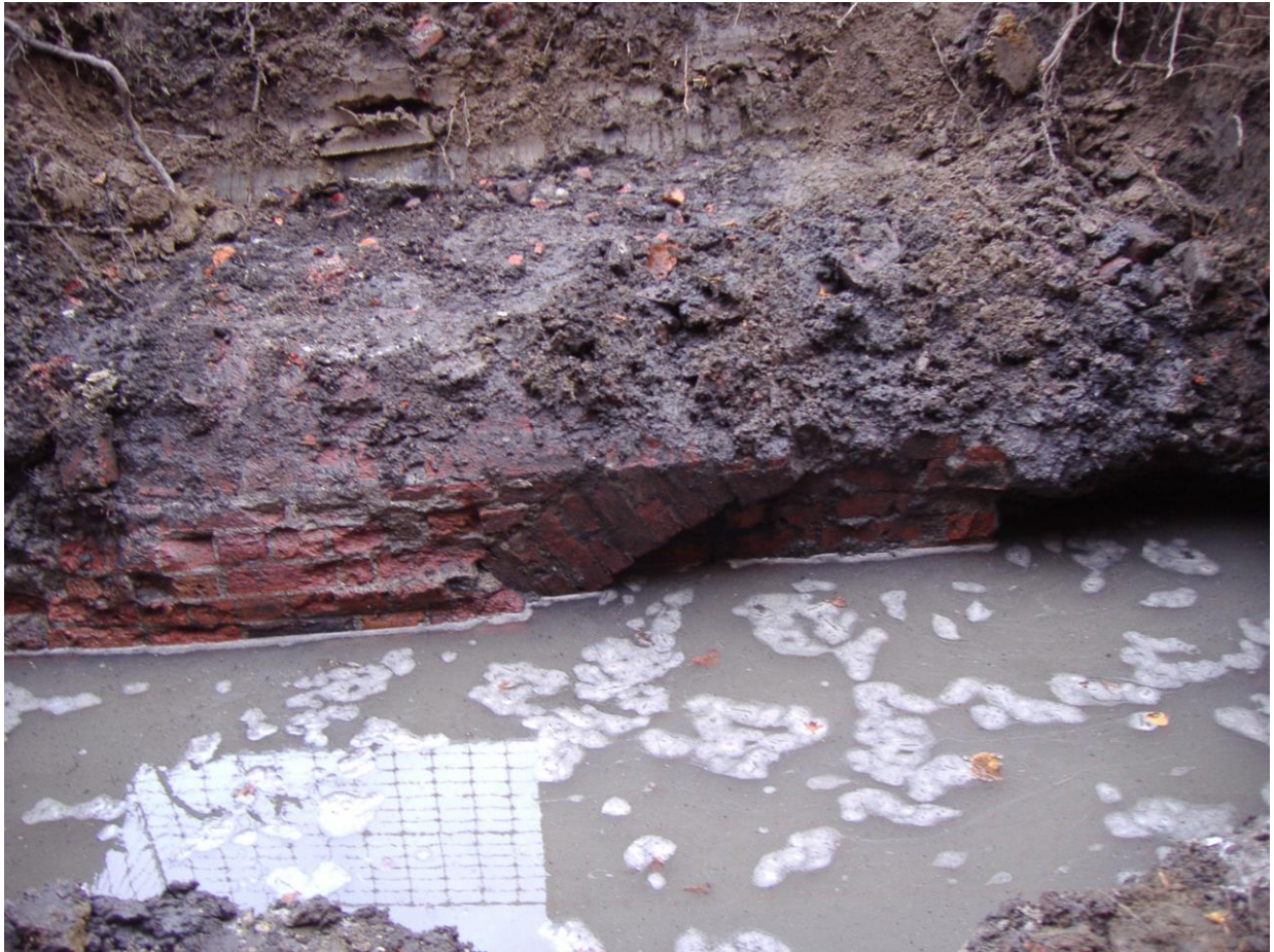
Fig. 3 Foto van de muurresten.