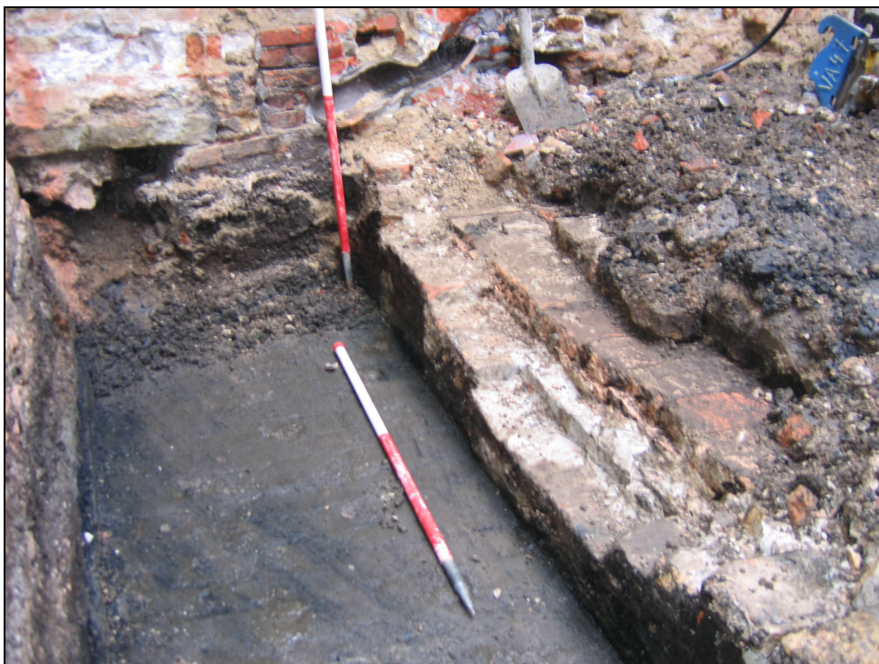
Afb. 5: Recente rioleringspijp die in de riolering uitmondt en de aanzet van een vloer opgebouwd uit bakstenen van groter formaat tegen de westelijk rioolmuur.