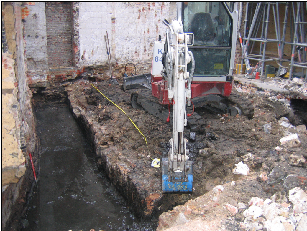
Afb. 3: Zicht op de binnenkoer vanaf de Rozemarijnstraat.

Bij aankomst op de site was het tongewelf van de riolering reeds volledig verwijderd (cfr. Afb. 3). Deze oude riolering bevond zich onder een bijgebouwtje, die op de achterkoer van het hoofdgebouw was gelegen en dus reeds was gesloopt. Dit bijgebouwtje was voorzien van een schouw.