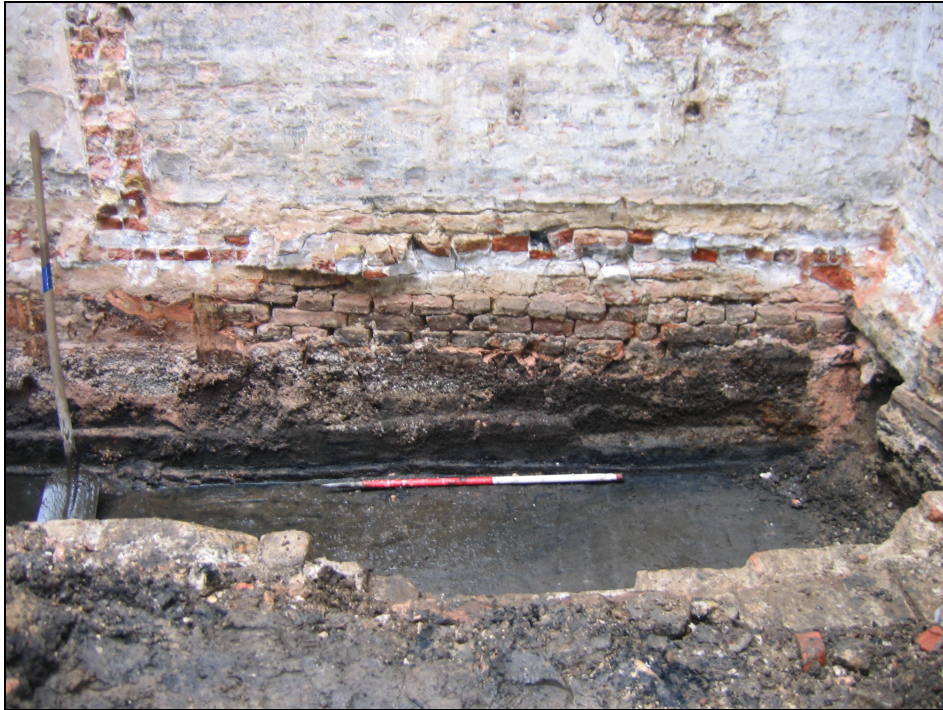
Afb. 4: Oude fundering en aanzet van het tongewelf.

baksteenformaten: 29,5x14x7cm & 28,5x14x6,5cm (cfr. Afb 4). De riolering vertrekt vanaf de zuidelijke perceelsmuur. Langs deze muur was nog de restant van een 20 ste eeuwse rioleringsbuis bewaard, die water in deze riool afvoerde. Naast deze toegang zat er nog een gat in de zuidelijke perceelsmuur (cfr. afb. 5). Mogelijk diende dit ook als toevoer van afvalwater in de riool.