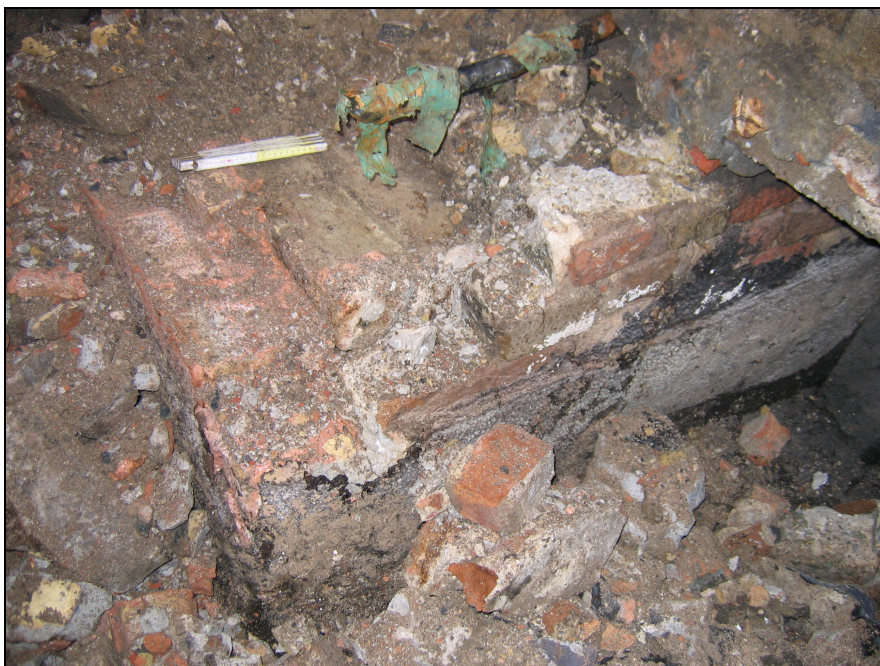
Afb. 7: Recente muur tegen oude kern aangebouwd.

Net voordat de riool onder de Rozemarijnstraat verdwijnt, was er een haakse zijvertakking in westelijk richting. Enkel de aanzet van deze zijvertakking was zichtbaar. Aangezien niet verder werd verdiept kon die niet verder geregistreerd worden. De noordelijke hoek van deze zijvertakking was de buitenmuur gevoegd met witgrijs cement. Opvallend was dat deze muur tegen een oudere structuur uit bakstenen van een groter formaat (S6) werd aangebouwd (cfr. afb. 7 ), waarop een recente nutsleiding liep.