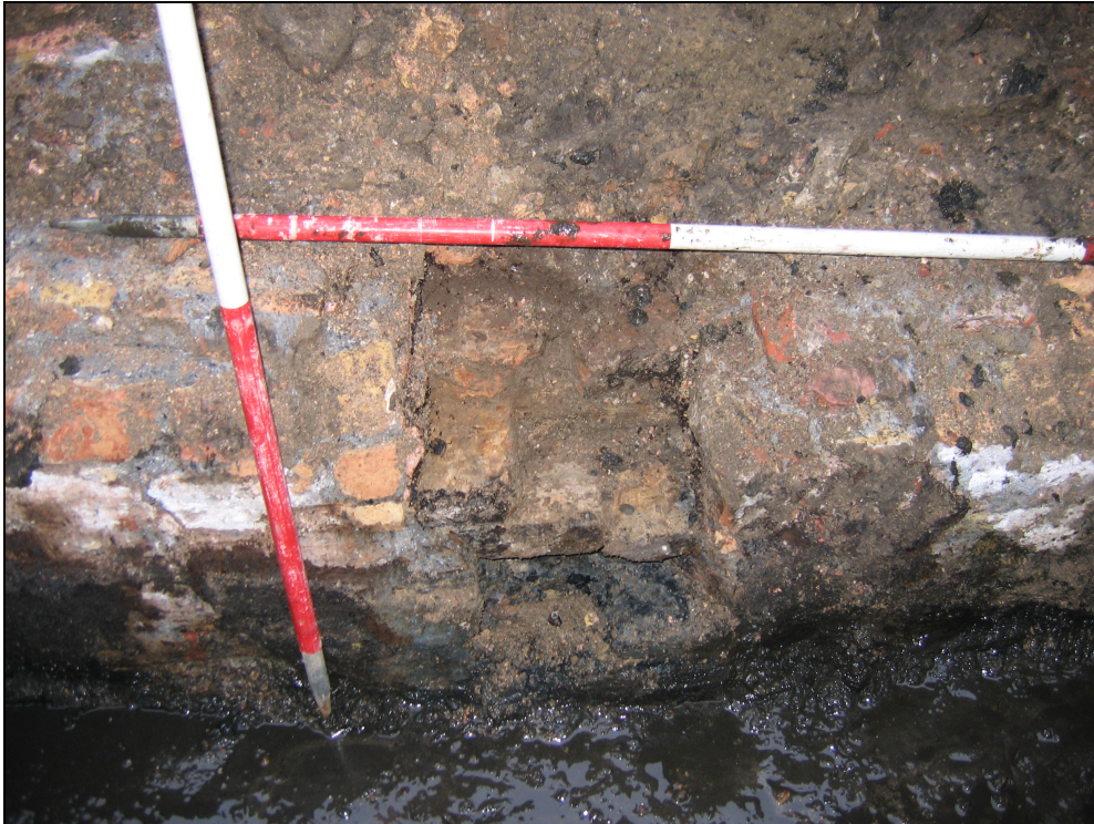
Afb. 8: Fasering in de zuidwestelijke muur.

In de westelijk muur van de riool zijn duidelijk meerdere fasen zichtbaar. S1 (de zuidelijkste fase) was opgebouwd uit grotendeels gerecupereerde bakstenen en was in het noorden gevoegd met grijswit cement en in het noorden, tegen S3, met grijs cement. Aangezien er vooral baksteenfragmenten in de muur zaten kon slechts één formaat worden geregistreerd: 23,5x12,5x4,5cm. Centraal zat er duidelijk een ouder muurfragment (S3), die overwegend was opgebouwd uit gerecupereerde bakstenen met gele kalkmortel ( cf. afb. 8 ). Er werd geen volledig bakstenen aangetroffen: Lx10x5,5 & LxBx4,5cm. Het verdere verloop van deze muur (S4) was gevoegd met grijs cement. Het gebruik van grijs cement, net als de recente rioleringspijp wijzen erop dat deze riolering zeker tot in de 2 de helft van de 20 ste eeuw werd gebruikt.