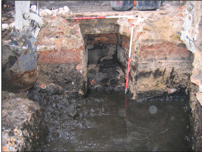
Afb. 6: Doodlopende riool onder de Rozemarijnstraat.

De vloer van de riolering (S5) was opgebouwd uit bakstenen en was bedekt met een harde mortellaag om de vloer waterdicht te houden. De hoogte van de bakstenen kon niet worden geregistreerd aangezien ze waren ingekapseld in mortel. De lengte varieerde tussen 18 & 19cm; de breedte varieerde van 9 tot 10cm. De vloer had een licht verval van 16cm over een afstand van 6,5m van zuidoost naar noordwest. De riolering liep dood onder de Rozemarijnstraat (cfr. afb. 6 ).