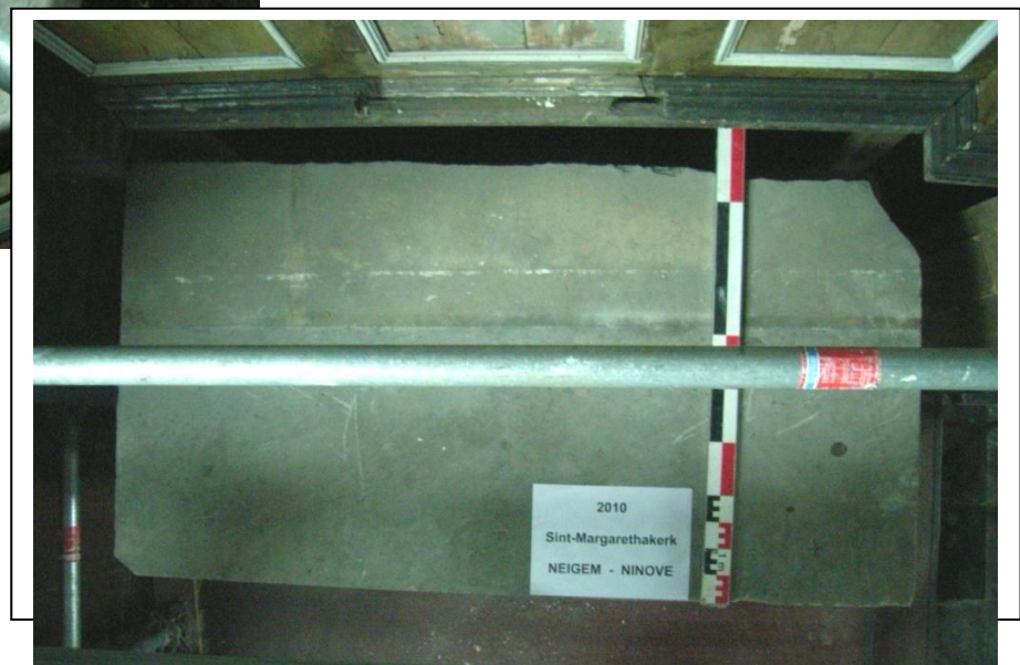
Figuur 9 : Bovenaanzicht altaar, natuurstenen plaat met 4 gegraveerde kruisjes