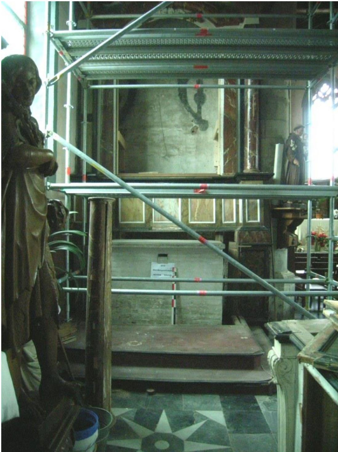
Figuur 6 : Bakstenen altaar