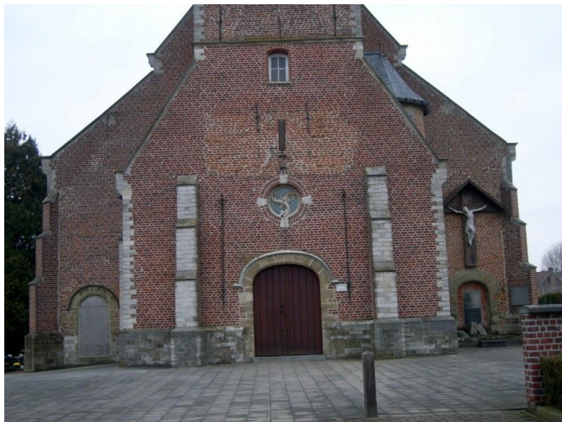
Figuur 3 : Grafplaten uit de 19 de eeuw in de gedichte rondboogdeurtjes van de westgevel