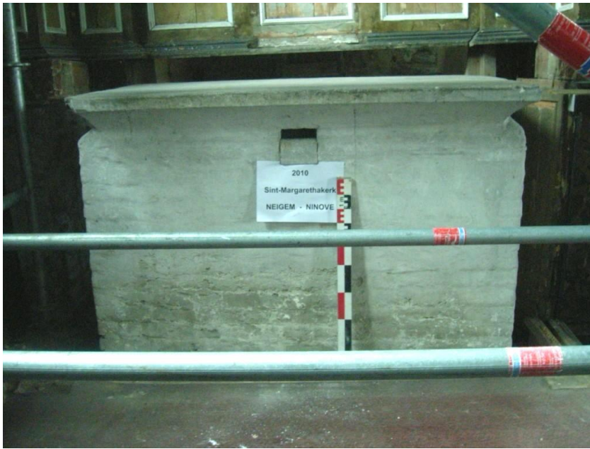
Figuur 7 : Bakstenen altaar - vooraanzicht