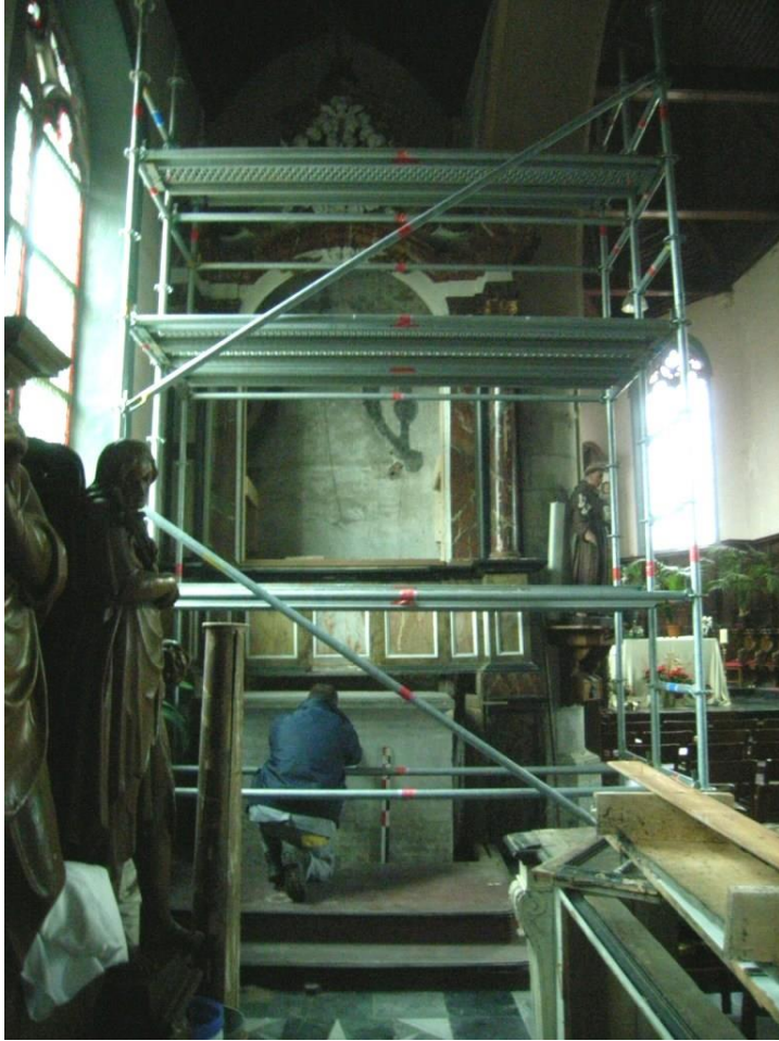
Figuur 4 : Gedemonteerd altaar in noordelijke zijbeuk. Verwijderde stukken op voorgrond