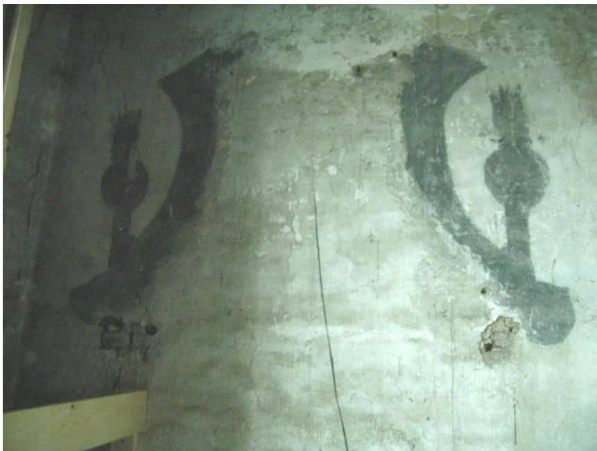
Figuur 5 : Muurschildering op oostwand van de noordelijke zijbeuk .