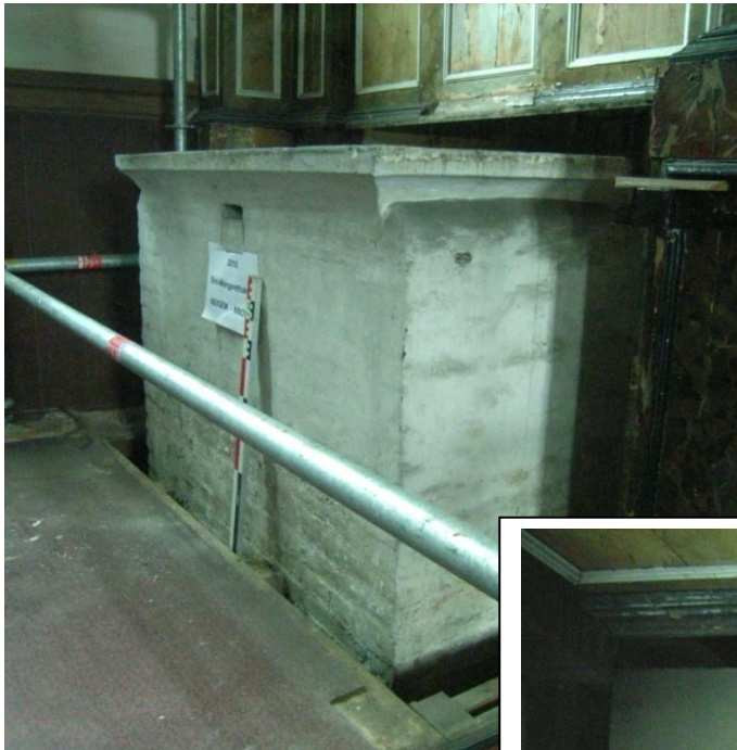
Figuur 8 : Zijaanzicht altaar