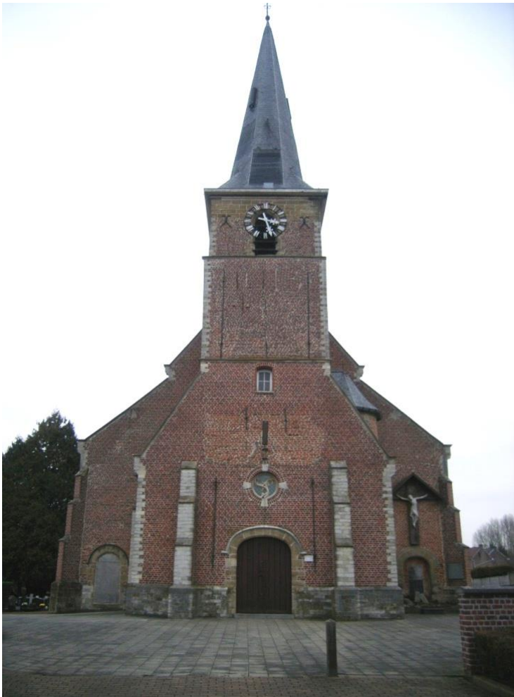
Figuur 2 : Westgevel Sint-Margarethakerk