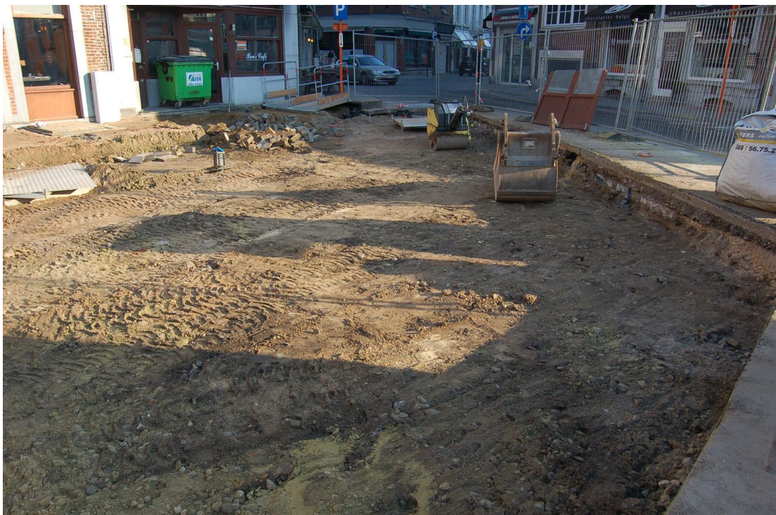
Fig.5: enkel de top van de donkere laag komt slechts op enkele plaatsen tevoorschijn.