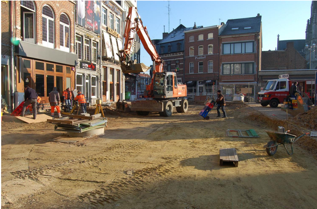
Fig. 4: Blik op de vernieuwingswerken vanuit het westen.