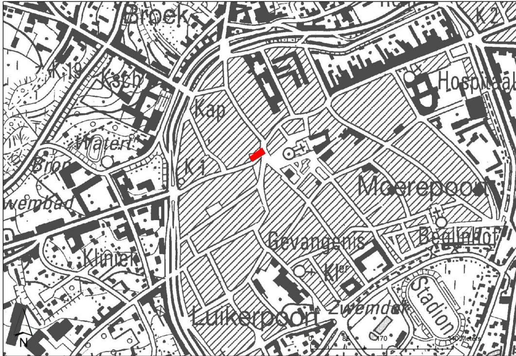
Fig. 2: Kadastrale kaart met aanduiding van de vindplaats in het rood.