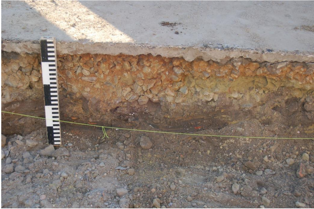
Fig. 6: onder de recente stabilisering - en nivelleringslaag ligt het topje van de zgn. donkere laag.