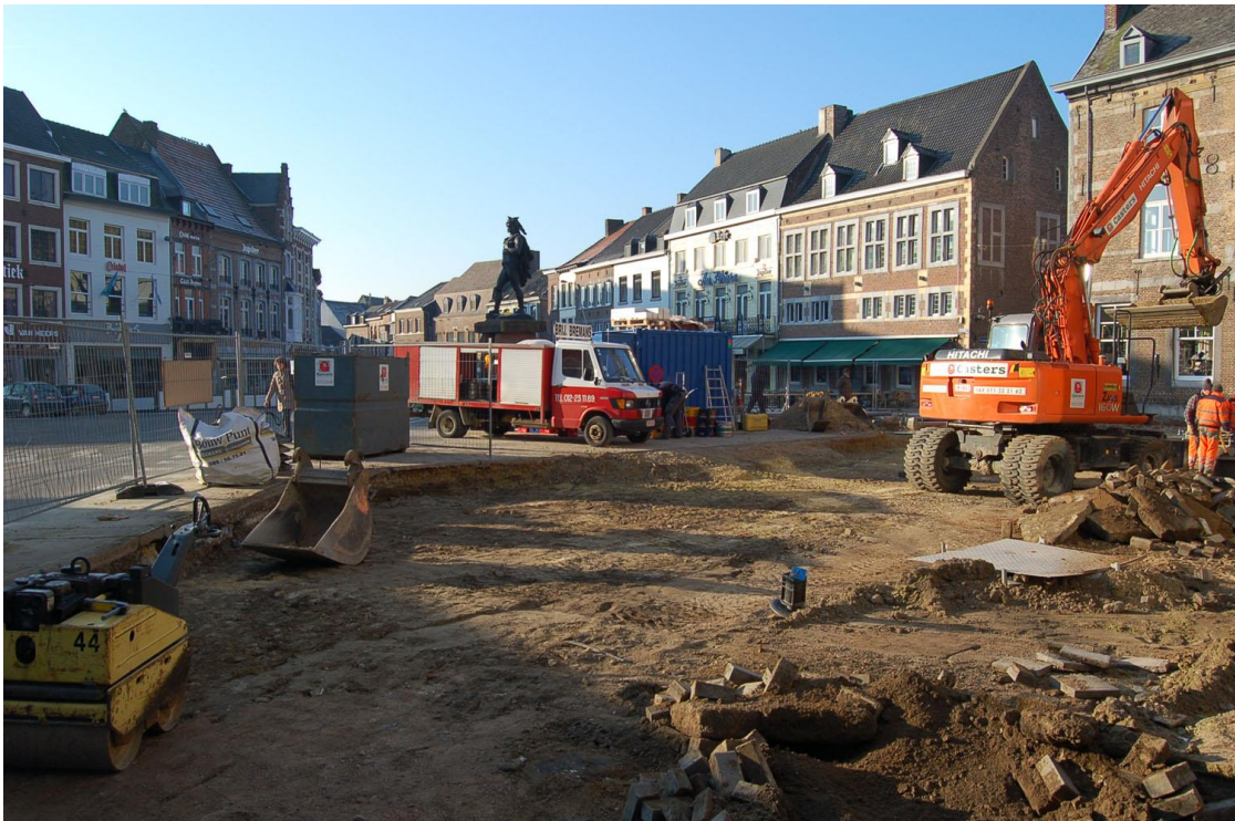
Fig. 3: Blik op de vernieuwingswerken vanuit het noorden.