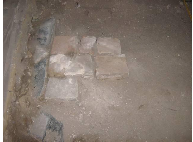
9 Fragment van een natuurstenen kerkvloer uit blauwe en witte tegels met aansluitend een aantal moefen