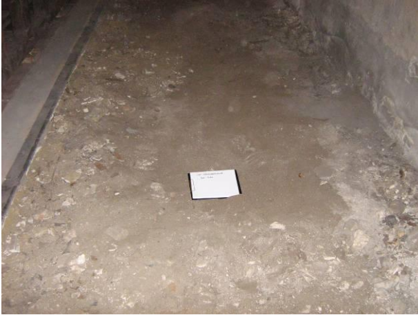
2 Terreinopname van koor noord bij aanvang van de werken

Bij aanvang van de werken waren beide delen van het koorgestoelte reeds verplaatst. Waar eens het koorgestoelte had gestaan, waren nu twee sleuven zichtbaar. De huidige kerkvloer liep niet door, in plaats hiervan was een dikke laag stof, vuil en bouwpuin zichtbaar geworden.