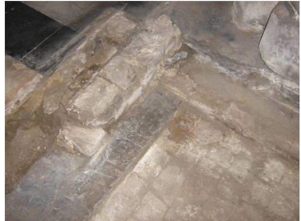
7 Bakstenen vloer met natuurstenen dorpel (noordelijke kant – zuidelijke kant van de sleuf: het niveau van de bakstenen sluit aan op het huidige vloerniveau).

Tegen de beide sleufranden was de tweede laag bakstenen bovenop de vloer nog volledig intact. Aan de noordelijke kant waren de bakstenen strek tegen strek geplaatst. Plaatselijk was ook nog een derde laag bewaard gebleven. Aan de zuidelijke kant lag een dubbele rij bakstenen kop aan kop.