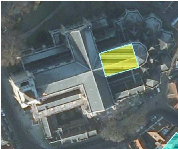
1 Het koor van de Sint-Salvatorskathedraal in Brugge

Ter hoogte van het historisch koorgestoelte zal alle afval en stof verwijderd worden, daarna zal een tiental cm aarde uitgegraven worden ter voorbereiding van de aanleg van een nieuwe vloer. Bij het uitgraven kunnen eventueel archeologische sporen (zoals historische begravingen) aangesneden worden. Slechts als de aangetroffen sporen de aanleg van de vloer en de terugplaatsing van het koorgestoelte bemoeilijken, zullen de sporen ook opgegraven worden. Dit zal besproken worden met de architecten die instaan voor de behandeling van het koorgestoelte en de plaatsing van de vloer maar behoud in situ staat voorop.