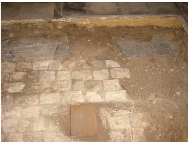
3 Houten steunblok bovenop vloer in baksteen

Bovenop deze vloer bevond zich nog een aantal van de vermoedelijk in 1930 geplaatste steunen van het koorgestoelte. In het oostelijke deel werd een houten blok teruggevonden (zie fig. 3). Aan de noordelijke rand van de sleuf, tegen de muur tussen het koor en de kooromgang, werden gemetselde pijlertjes teruggevonden. De opbouw, nu eens met kleine bakstenen dan eens met hergebruikte moefen, en positionering van de pijlertjes vertoont weinig systematiek.