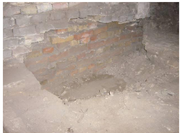
8 Uitbraak voor de aanleg van het stookkanaal en recente herstelling van de tussenmuur.

Bovenop het stookkanaal was geen vloer meer aangelegd, de aanlegput was opgevuld met aarde, bouwpuin en zavel. Aan de zuidelijke kant van de put was de bakstenen vloer afgeboord met een rij bakstenen, zie fig. 9. Tussen het puin werd nog een restant van een andere, oude natuurstenen kerkvloer aangetroffen. Er was slechts een klein stuk zichtbaar maar deze vloer is