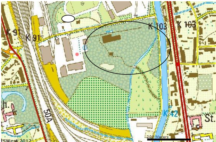
Fig. 1: Het projectgebied aangeduid op de topografische kaart

Het archeologisch proefonderzoek heeft tot doel het inventariseren en waarderen van het potentieel archeologisch erfgoed, dat door de geplande werken wordt verstoord. De resultaten worden geëvalueerd om de voordien ongekende, archeologische waarde van het bodemarchief vast te stellen en indien nodig een vervolgonderzoek in de vorm van een opgraving aan te bevelen.