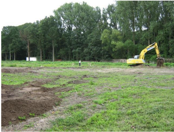
Fig. 5: Het uitgraven van de funderingsputten.

Hoewel dit oorspronkelijk wel gepland was, werd op basis van al deze bevindingen besloten op de rest van het terrein (eveneens voormalig bos) geen archeologisch proefonderzoek te verrichten.