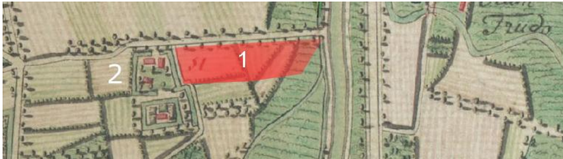
Fig. 1: De projectlocatie op de Kabinetskaart (1: projectlocatie, 2: hoeve 'Ten Briele')

Een kort historisch-cartografisch onderzoek bevestigt deze gegevens. Op de kabinetskaart van Ferraris (1770-1777) herkennen we ten oosten van het onderzoeksterrein de historische hoeve 'Ten Briele'. Het projectgebied wordt volledig ingenomen door akker- en weiland (zie fig. 3).