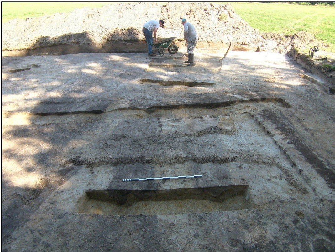
Fig.7 Coupes op gedeelte van de karresporen.