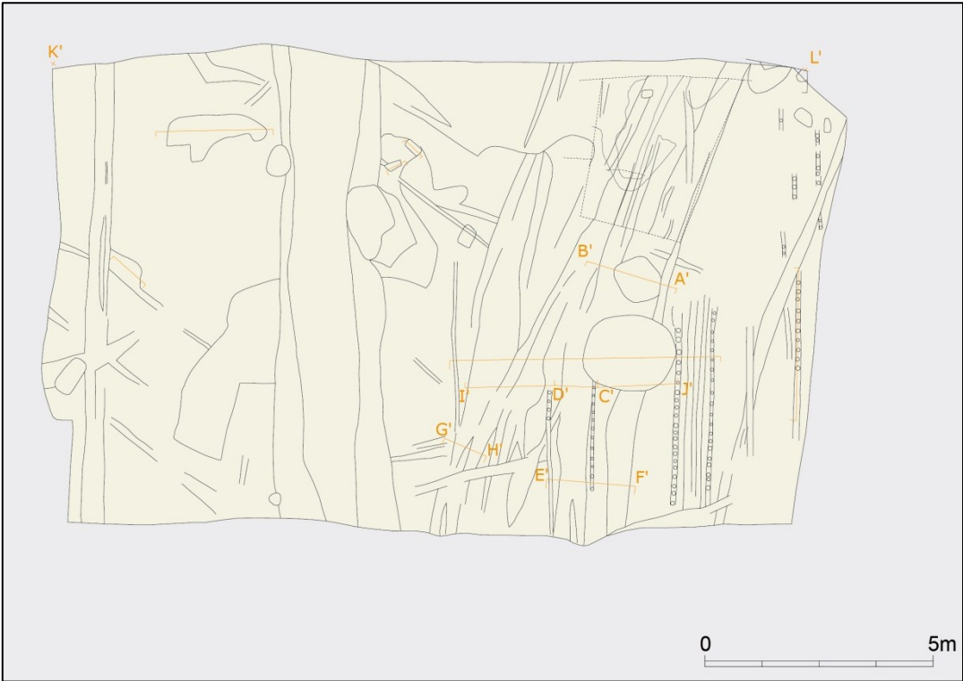
Fig.5 Sporenplan (1/155)