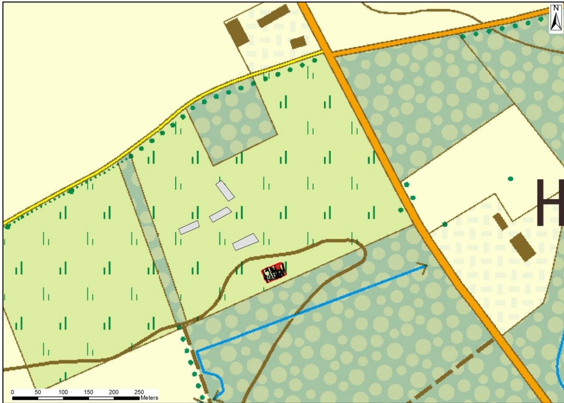
Fig.2 De onderzoekslocatie in detail, met - luchtfotografisch gegeoreferereerde – inplanting van enkele Duitse barakken. (1/7812)