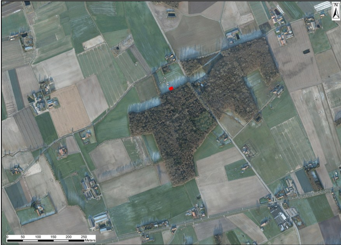
Fig.4 Situering van de ingreep op een actuele luchtfoto. (1/7812)