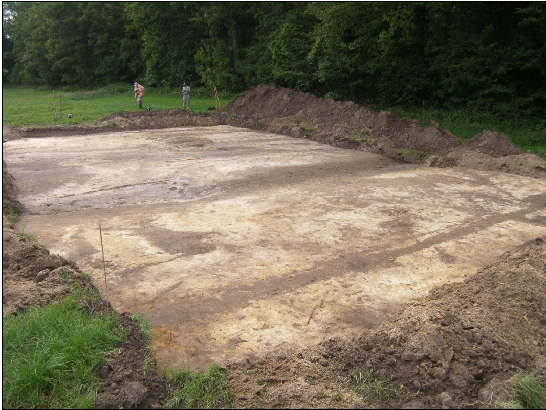
Fig.6 Opgravingsporen. De karresporen werden aangetroffen in het verste gedeelte.