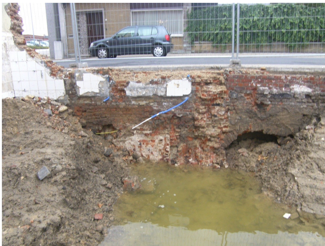
Fig.6. Zicht op het structureel duidelijkste restant