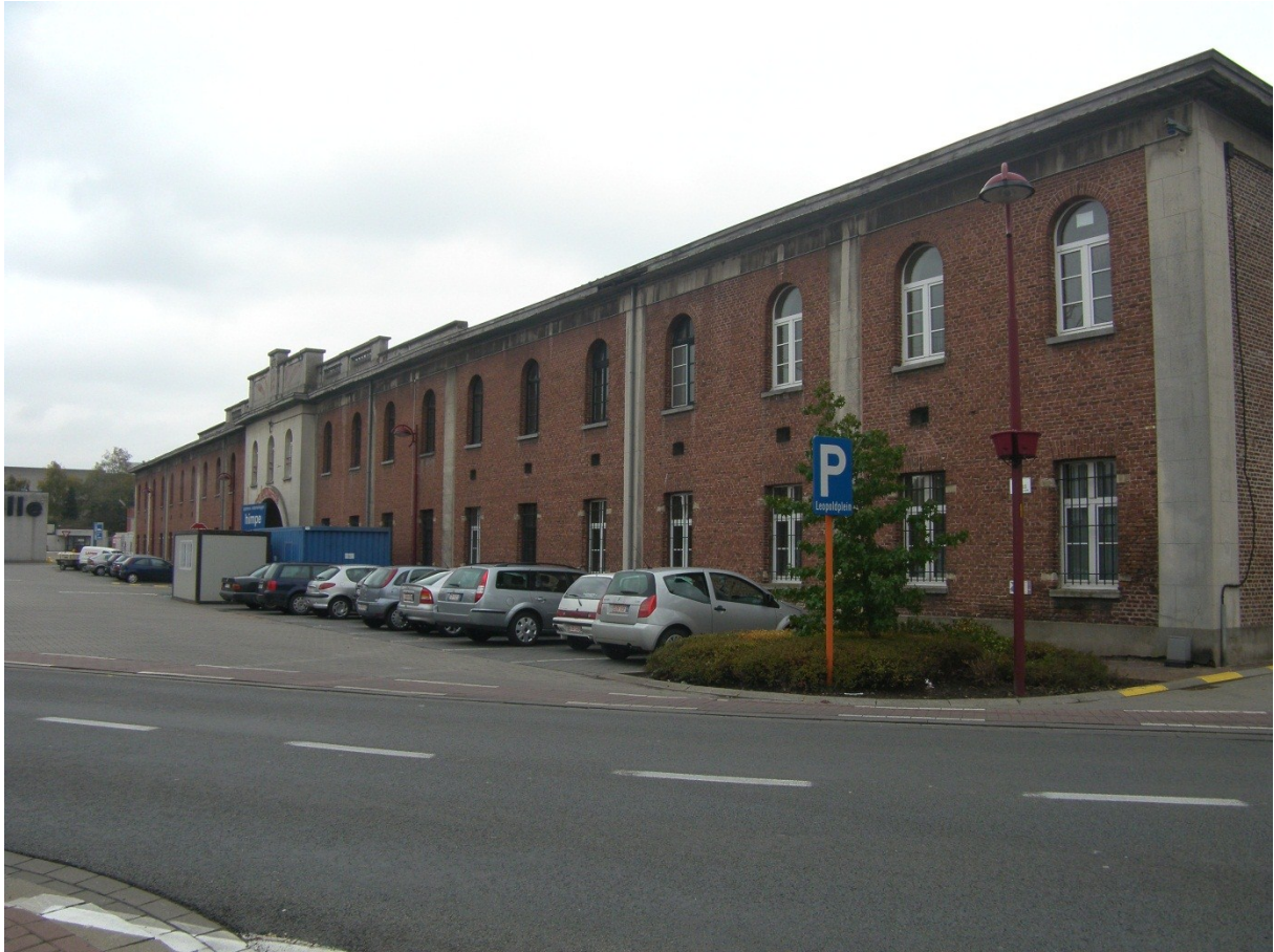
Fig. 1. Het voormalig Hollands militair hospitaal vanuit het westen