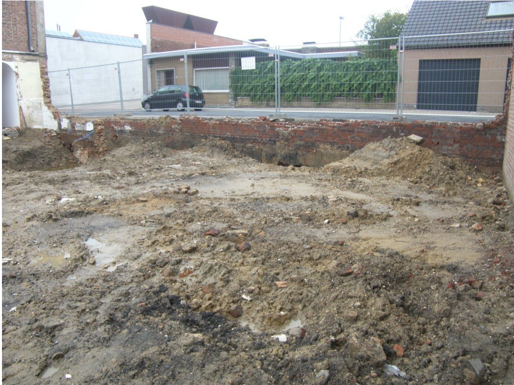
Fig.3. De muur in kwestie, deels vrijgekomen bij de voorbereidende werken