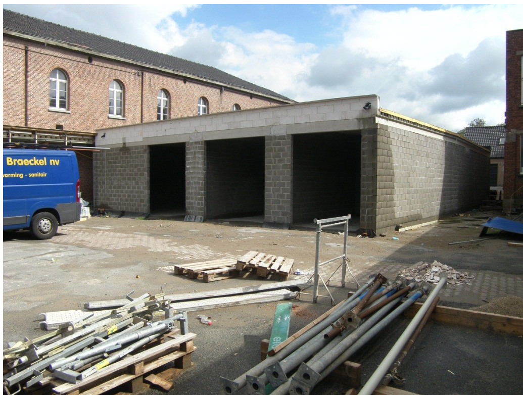
Fig.5. De uiteindelijk gerealiseerde parking, vanuit het binnenplein