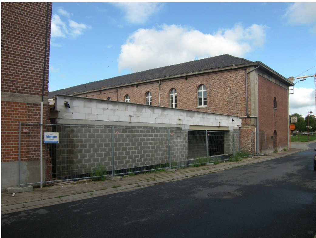
Fig.4. De uiteindelijk gerealiseerde parking, vanop de straat