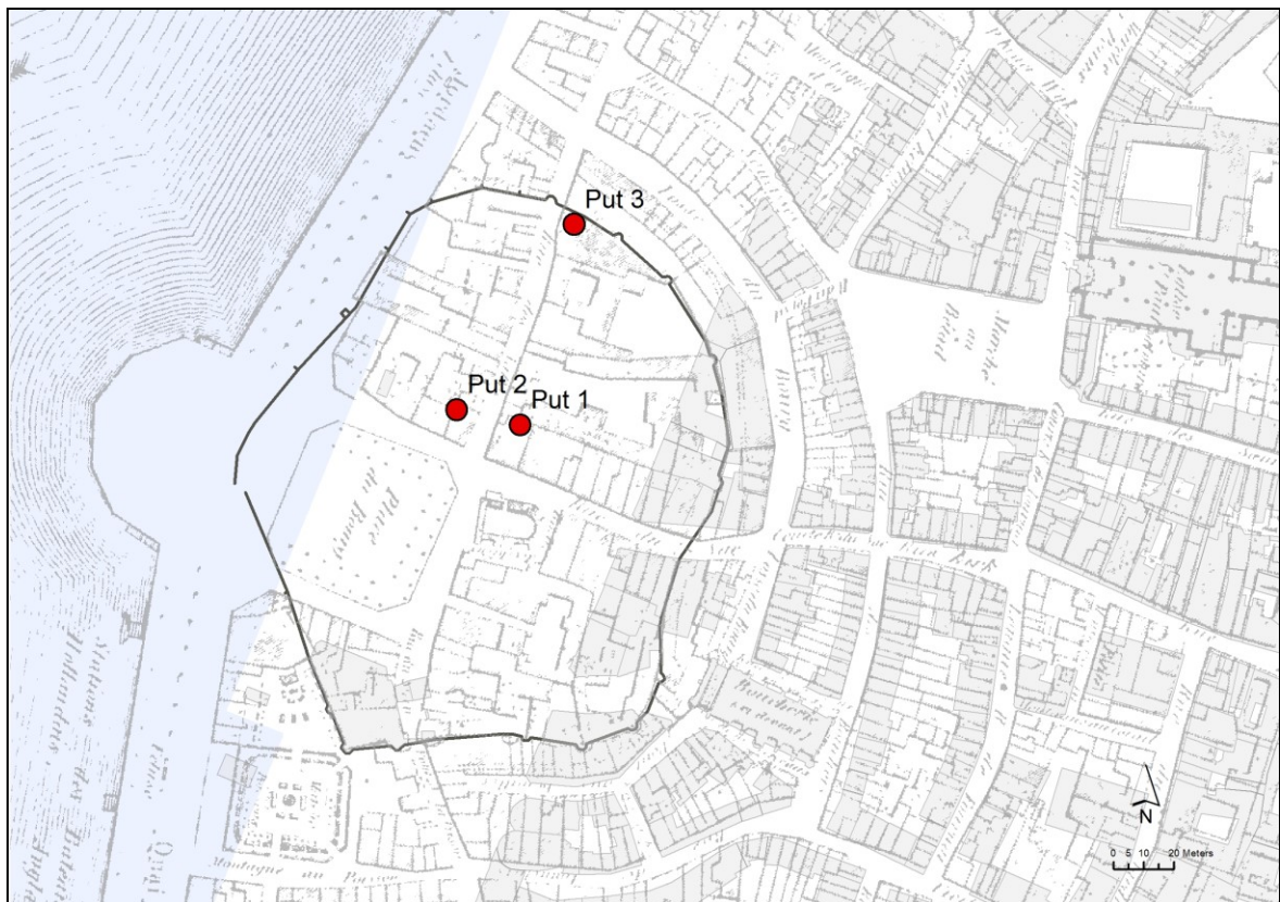
Figuur 3. Situering van de putten op huidig stadsplan en Lossonkaart (°1846). De zwarte lijn geeft het tracé van de burchtmuur weer, gebaseerd op laat-19de-eeuwse kaarten

Het terreinwerk nam, op uitzondering van de werfbezoeken, twee werkdagen in beslag. In totaal werden drie putten geregistreerd en onderzocht. Put 1 bevond zich ter hoogte van de afdakkolommen 7/4 en 8/4, put twee ter hoogte van de kolommen 6/3 en 7/3 en put 3 op het parkingdeel ter hoogte van de kolommen 13/4 en 14/4.