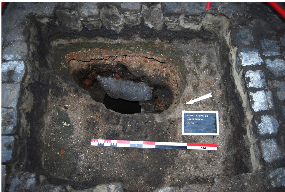
Figuur 12. Overzicht put 3, zicht naar het oosten