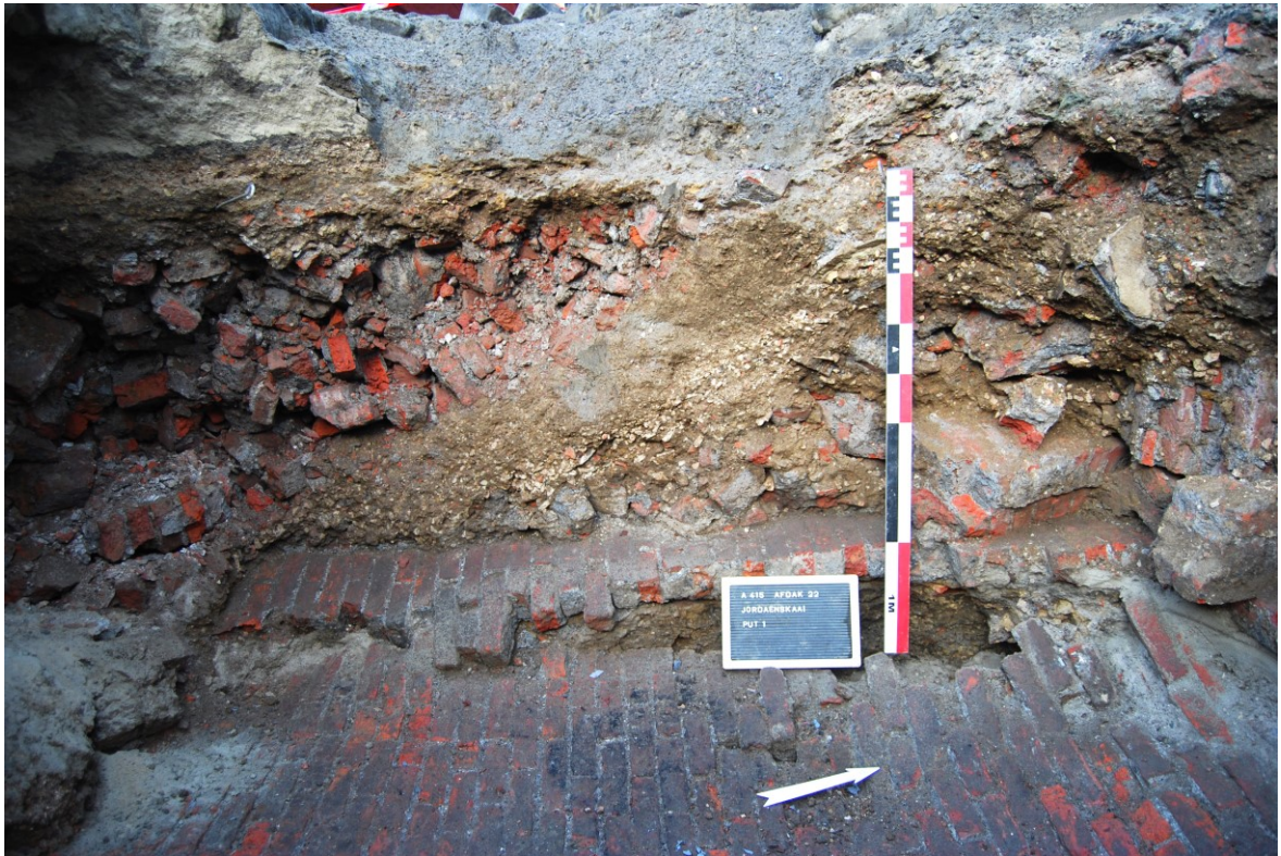
Figuur 5. Profiel westelijke wand put 1