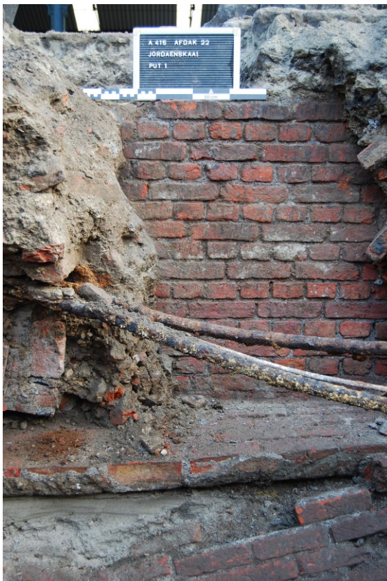
Figuur 6. Noordelijke wand put 1 met muur in kruisverband