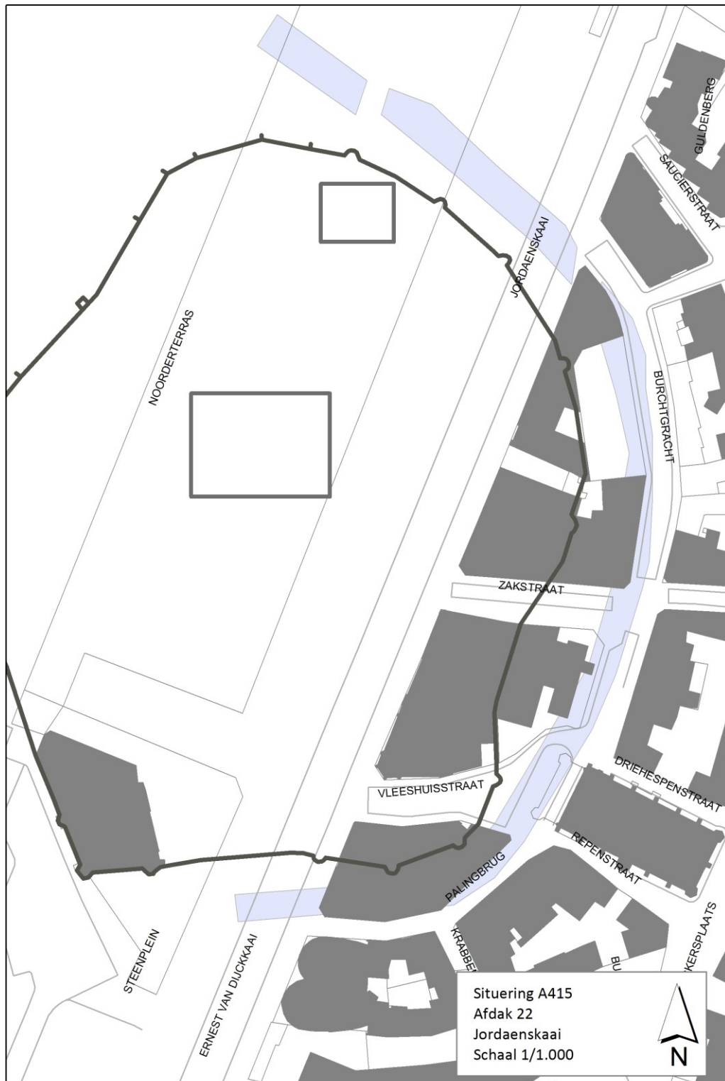
Figuur 2. Situering onderzoekszones A415 Afdak 22 Jordenskaai