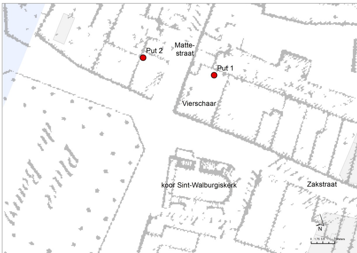
Figuur 7. Situering putten 1 en 2 op geprojecteerde en geannoteerde Lossonkaart (opmerking: de Lossonkaart toont de 19 de -eeuwse magazijnen; de Vierschaar zou dan al afgebroken zijn)

De waargenomen muur- en kelderdelen in put 1 betreffen postmiddeleeuwse steenbouwresten van een verdwenen bouwblok ten oosten van de middeleeuwse Mattestraat, vóór het rechte trekken van de kaaien en het slopen van de daar gesitueerde bouwblokken. Put 1 ligt tussen de sites A002 Besaenhuis en A003 Sint-Walburgis, opgegraven in de periode 1952-1961 door Van de Walle. Op basis van geprojecteerde historische kaarten werd duidelijk dat put 1 zich situeert in de noordelijke helft van de voormalige Vierschaar, waar eeuwenlang recht gesproken werd. In 1815 zou het oude gebouw afgebroken zijn door de stad om plaats te maken voor magazijnen (Ketgen PK2275 f1; archiefonderzoek door K. GEERTS). De geregistreerde gebouwdelen behoren naar alle waarschijnlijkheid toe aan de magazijnen die na 1815 tot stand kwamen, tot de afbraak ervan in de jaren 1870.