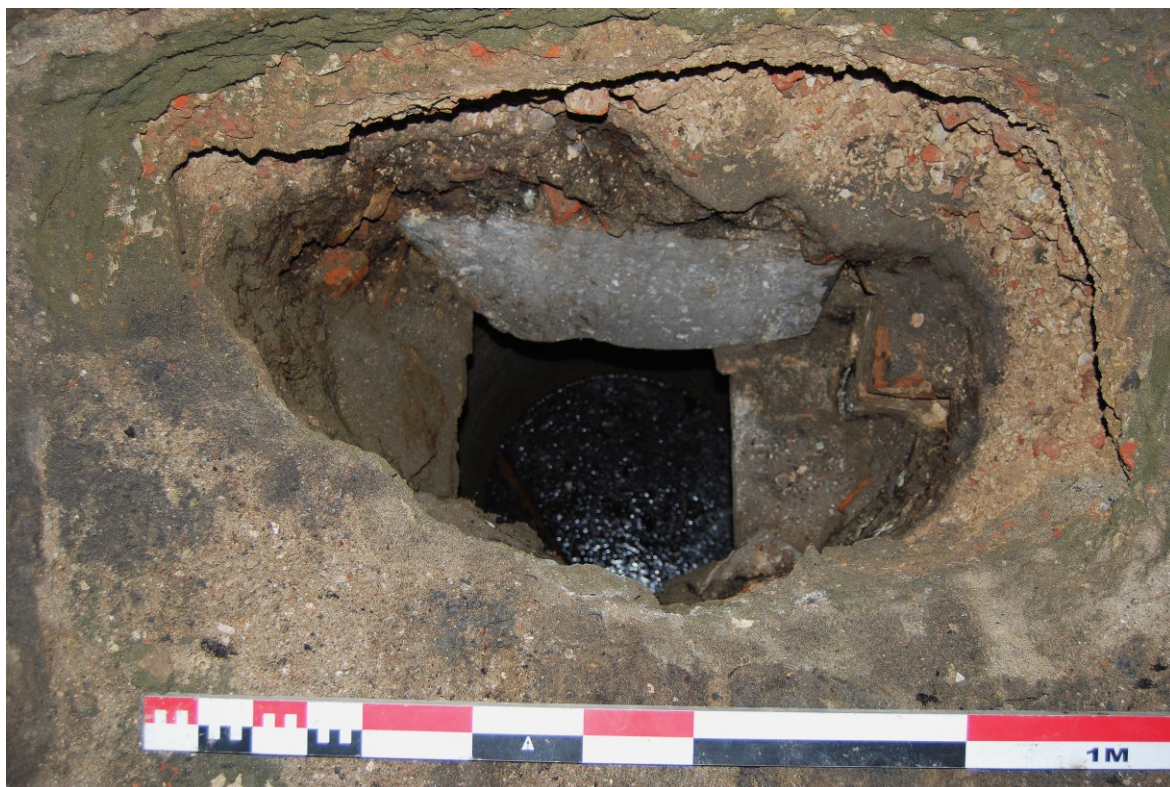
Figuur 13. Detailopname van de dekstenen en de waterput