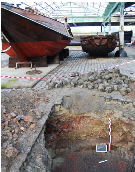
Figuur 4. Overzicht put 1, zicht naar het westen

In put 1 werden geen archaeologica (mobiele vondsten) aangetroffen.