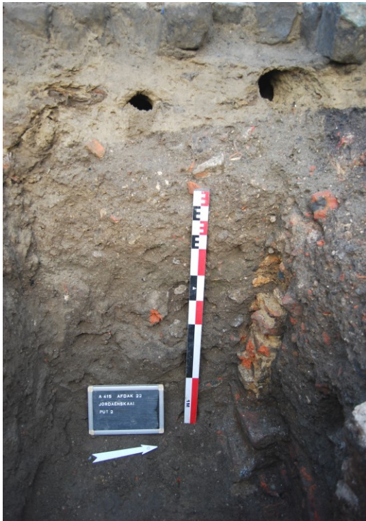
Figuur 9. Profiel westelijke wand put 2