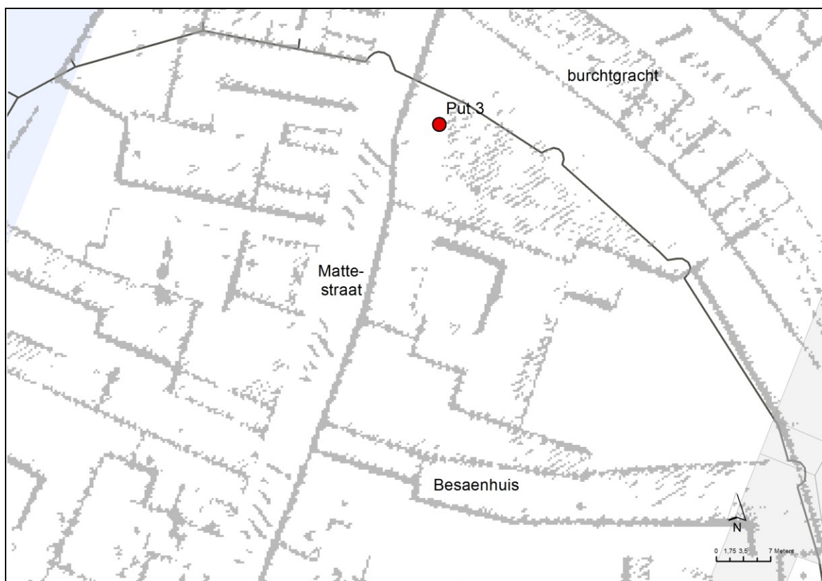
Figuur 11. Situering put 3 op Lossonkaart

Put 3 situeert zich ter hoogte van het verdwenen bouwblok ten oosten van de Mattestraat, net ten zuiden van de middeleeuwse burchtmuur, wellicht bovenop de vroegmiddeleeuwse aarden wal. Ter hoogte van de parking onder het Noorderterras vertoonde het kadeplateau een in oppervlakte beperkte maar diepe verzakking, tot ca. 4 m onder de kasseibestrating. Na het verwijderen van enkele kasseien tot een vierkant werkvlak werd een ronde bakstenen waterput opgemerkt. De waterput bleek afgedekt door een drietal natuurstenen dekstenen, waarvan de middelste opengebroken was en op zijn kant geplaatst. Hierdoor kon bovenliggend puin en zand in de waterput vloeien, wat meteen de oorzaak van de verzakking verklaarde. De diameter van de waterput kon door belemmering van de dekstenen niet opgemeten worden maar bedraagt naar schatting 70-90 cm. De waterput kan op basis van bouwwijze, bouwmaterialen en stratigrafische positie als postmiddeleeuws bestempeld worden, vermoedelijk uit de 19 de eeuw, net als de resten in put 1. Gelet op de functie en bouwwijze gaat de putschacht mogelijk doorheen de onderliggende aarden wal.