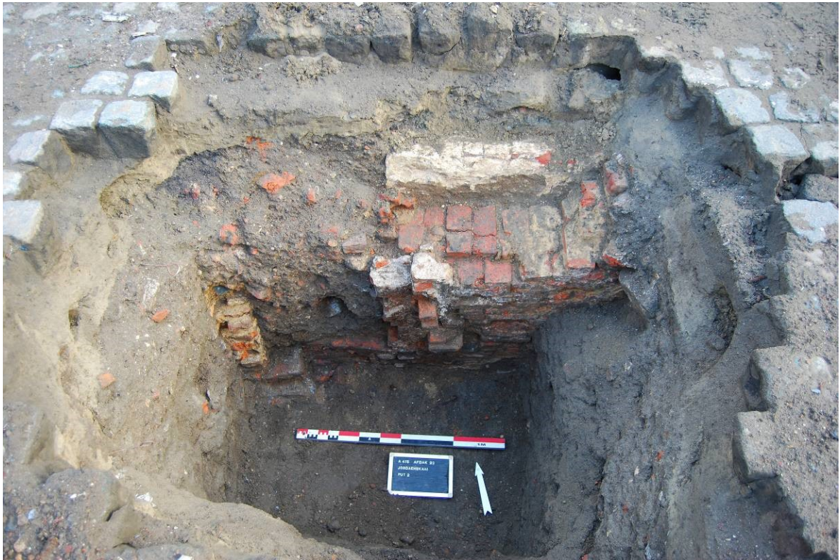
Figuur 8. Overzicht put 2, zicht naar het noorden

Het betreft een gegraven put, geen verzakking. De put werd machinaal gegraven om de bestaande riolering te lokaliseren. In de put werd het profiel van de westzijde opgetekend op schaal 1/10. Het profiel vertoont de kasseibestrating en funderingsbedding, bovenop een met zand en in mindere mate bouwpuin opgevulde bouwsleuf, aangelegd voor de bestaande riolering. De bouwsleuf doorsnijdt een puinpakket en een baksteenmuur. In de noordelijke putwand zijn twee koud tegen elkaar geplaatste muren waar te nemen, op 6,7 m (TAW-waarde). De ene bestaat uit bakstenen met variabele grootte (onder meer 20,5 x 10 x 3,5 cm) en gele kalkmortel; de andere muur is van latere datum en bestaat uit baksteen en witte, harde kalkmortel. De baksteenstructuren zijn wellicht van postmiddeleeuwse datum, al dan niet met hergebruik van ouder bouw materiaal. Onderliggende oudere lagen, sporen of structuren konden niet in kaart gebracht worden.