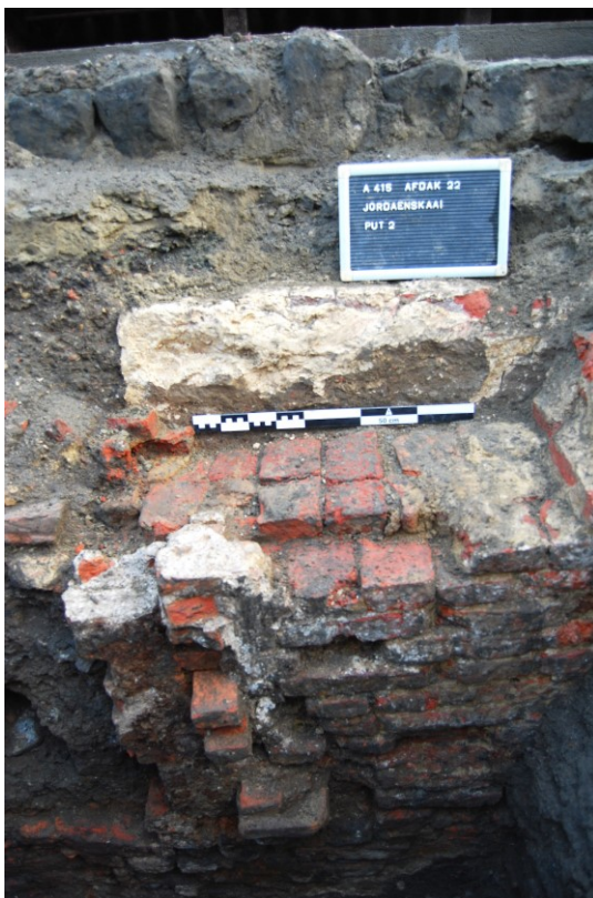
Figuur 10. Noordelijke wand put 2 met twee muurdelen