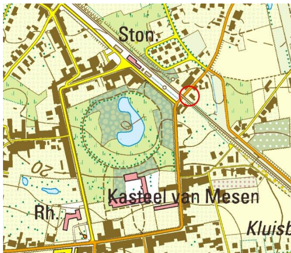
Fig.1 Situering op de topografische kaart