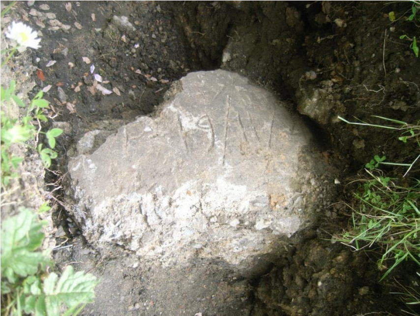
Fig.8 Betonblok met datum 19/11/4(?)