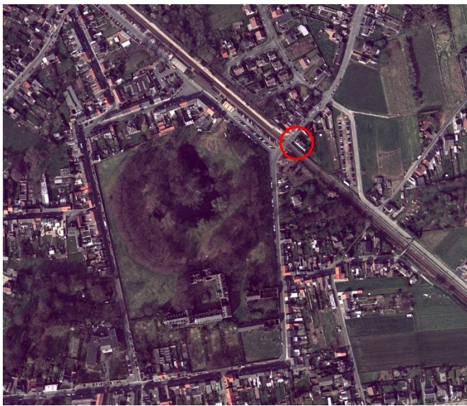
Fig.3 Situering op de luchtfoto