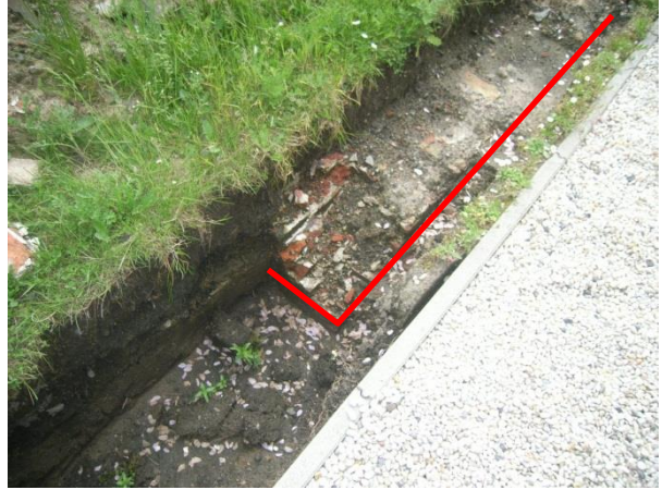
Fig.6 Fotografische registratie van de aangetroffen resten.