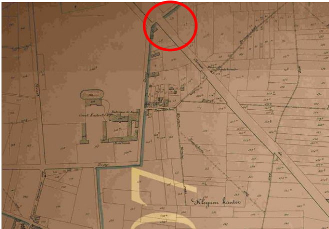
Fig.4 Situering op de Popkaart