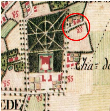
Fig.5 Situering op de Ferrariskaart (