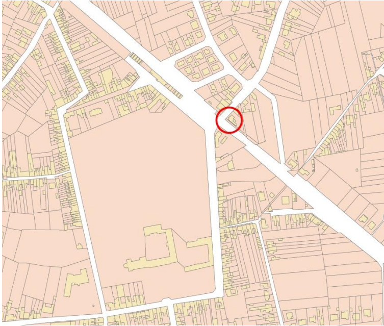
Fig.2 Situering op het kadasterplan