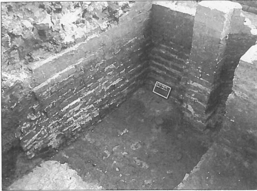
Bakstenen fundering onder de hoek van de Wangenhaard.

laag aangetroffen die kan geïnterpreteerd worden als een cultuurlaag en in verband kan gebracht worden met dit hof. In de laag werden slechts enkele grijsgebakken scherven aangetroffen, die algemeen kunnen gesitueerd worden in de 13-14de eeuw. Later werd deze laag, tijdens de voorbereiding voor de bouw van het kasteel, afgedekt en ongeveer met een halve meter opgehoogd.