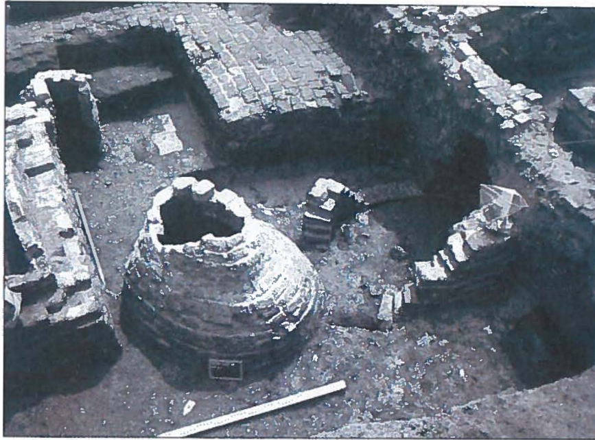
15de- en 17de-eeuwse waterput.

onderscheiden worden. Aan de straatkant bevond zich de 'voorkamer' met binnenwerkse afmetingen van 4,76 bij 4,10 m.