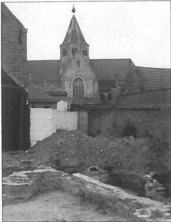
Gezicht op de opgravingen