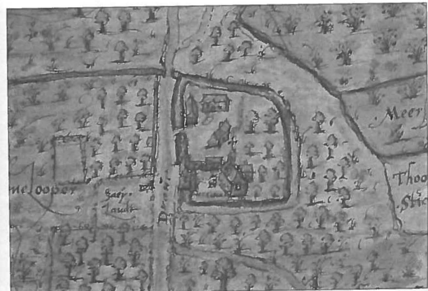
De proosdij op het plan van 1567 (RAG, Kaarten en Plans, nr. 602).

Reeds eind 12de eeuw bestaat er een monastieke stichting met een kapel en een proosdij afhankelijk van de St.-Baafsabdij van Gent. Dat er zich reeds in de 12de eeuw een kapel bevindt, blijkt uit een vermelding in 1170 over een geschil tussen de pastoor van Maldegem en de proost van de kapel van Papinglo, een geschil dat beslecht wordt ten voordele van de pastoor van Maldegem.