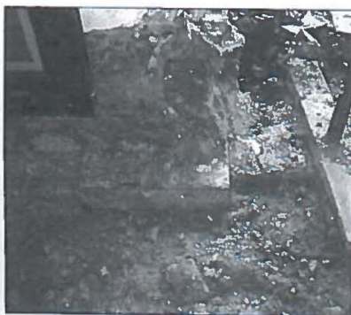
Bovenaanzicht van een gedeelte van de noordelijke funderingsmuur van de kapel.

Naar aanleiding van de inrichting van een hotelcomplex op de historische site van Papinglo in Maldegem-Kleit, werden eind 2006, voorjaar 2007 enkele archeologische waarnemingen uitgevoerd, die toelaten een aantal historische vermeldingen te staven. De waarnemingen waren mogelijk dankzij de bereidwilligheid van de heren J. Meerschman en E. Van Holsbeke van de firma Mevaco en door tussenkomst van N. Lemay van het Agentschap RO van de Vlaamse Gemeenschap, waarvoor we hier onze dank willen uitspreken.