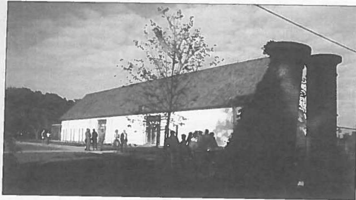
Oud en nieuw met mekaar verzoenen...

Ook wat betreft de steunberen vinden we in voornoemde passage het volgende: "aan beide zijden waren vijf grote pijlers en twee aan iederen kant van de gevels. Er was een prachtig portaal en een schone gevel, waarboven een kloktorentje oprees".