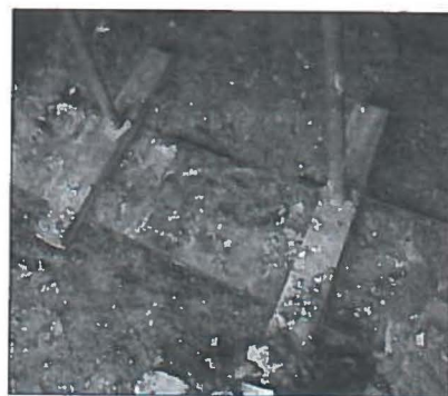
Bovenaanzicht op een van de vrijgekomen steunberen van de noordelijke funderingsmuur van de kapel.