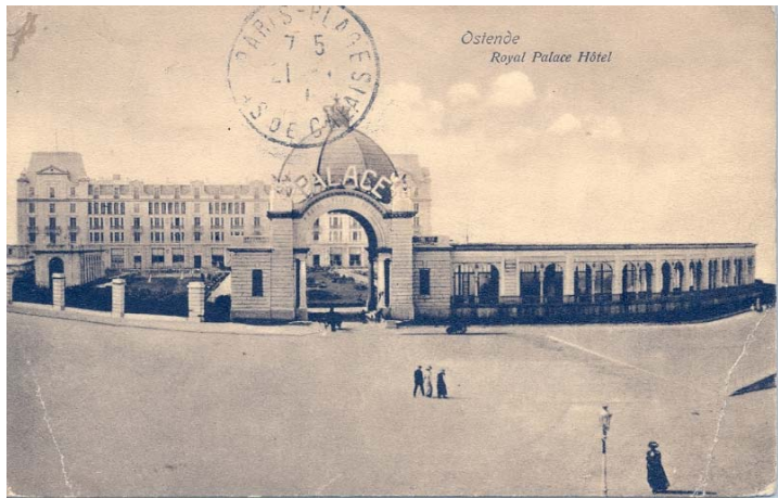
Royal palace hotel

Met de bouw van het 'Royal Palace' hotel werd op het einde van de 19 de eeuw van start gegaan.