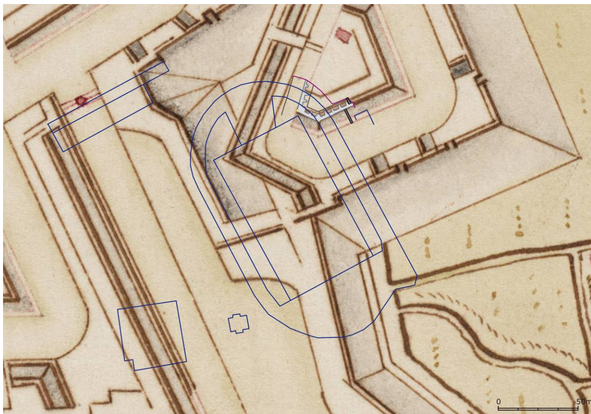
Fig. 3. Gedetailleerde lokalisatie van de vondst op een eind 17 de -eeuwse kaart