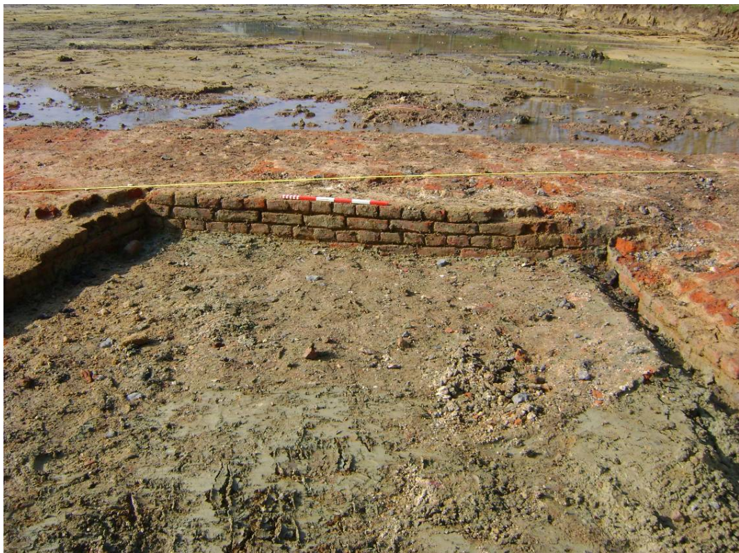
Fig. 7. Zicht op het metselverband