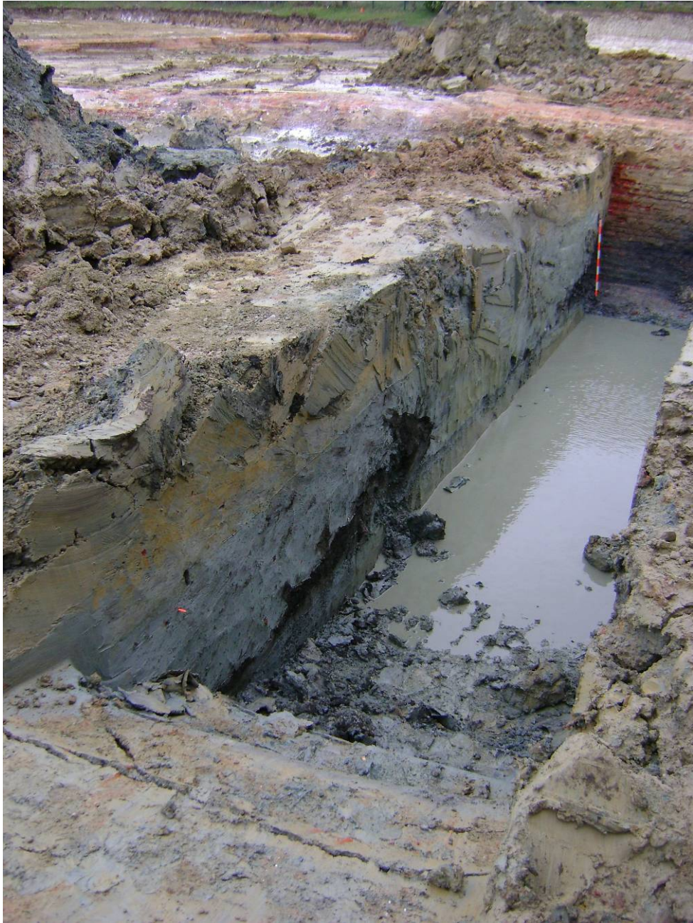
Fig. 10. Zicht op de stratigrafie aan de buitenkant van de muur