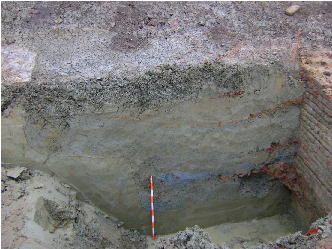
Fig. 9. Zicht op de aanleg sleuf