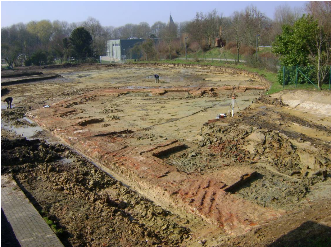
Fig. 6. Algemeen zicht op de muurresten