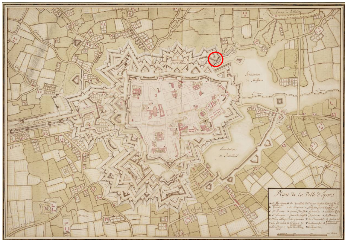
Fig. 2. Algemene lokalisatie van de vondst op een eind 17 de -eeuwse kaart