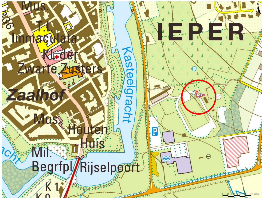
Fig. 1. Lokalisatie van de vondst, op de NO-hoek van de atletiekpiste