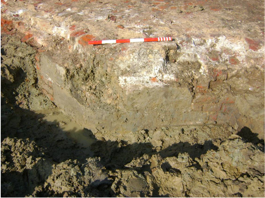
Fig. 8. Zicht op een, met natuursteen versterigde hoek