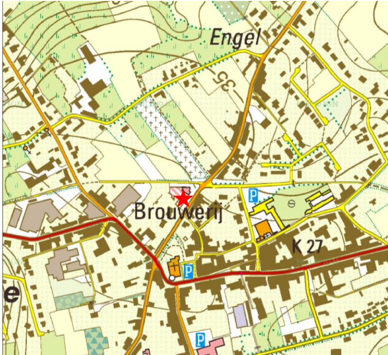
1 Lokalisatie van het te onderzoeken terrein op de topografische kaart (schaal 1:10.000).

Naar aanleiding van de geplande nieuwbouw aan de Steenstraat 2-4 in Aartrijke zijn een aantal proefsleuven getrokken. Kadastraal bevindt het gebied zich in afdeling 4, sectie B, perceel nr. 1652s.