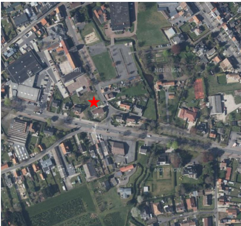
2 Lokalisatie van het projectgebied op de orthofoto.