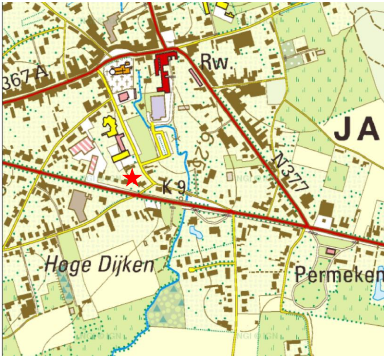
1 Lokalisatie van het te onderzoeken terrein op de topografische kaart (schaal 1:10.000).

Het projectgebied is te situeren op de hoek van de Kapellestraat en de Gistelse Steenweg in Jabbeke. Het gaat om de huisnummers 18 tot 22. Het betreft afdeling 1 van het kadaster, sectie C, percelen nrs. 377T en 377W.