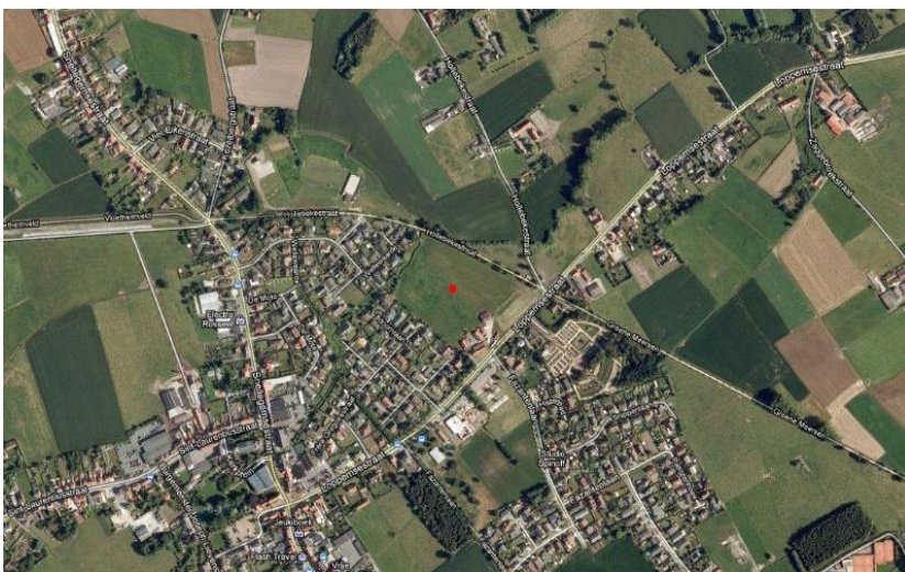
2 Lokalisatie van het te onderzoeken terrein op de orthofoto.