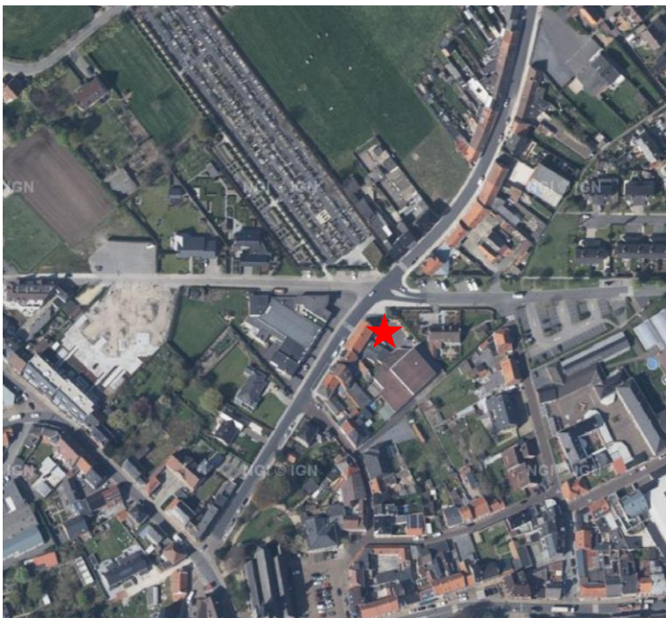
2 Lokalisatie van het projectgebied op de orthofoto.