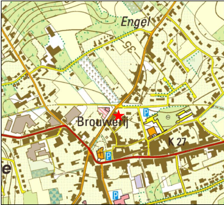
1 Lokalisatie van het te onderzoeken terrein op de topografische kaart (schaal 1:10.000).

Het projectgebied bevindt zich in het centrum van Aartrijke (Zedelgem), aan het begin van de Steenstraat (huisnummer 1). Op deze plaats is een nieuw crematorium gepland net naast de bestaande serviceflats. Het gaat om de percelen 1379r, 1379v, 1397w en 1377r in sectie van de kadastrale afdeling 4.