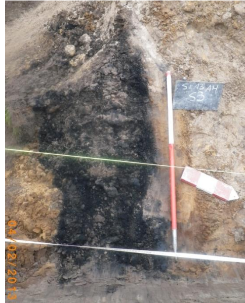
Figuur 6: Crematiegraf S6

Spoor 3 is eveneens een NO-ZW georiënteerde grafkuil en meet circa 175cm op 50cm. Het spoor bevond zich deels in de wand. Eerst werd de profielopbouw geregistreerd (zie fig.7), waarna het volledige spoor bemonsterd werd. Beide graven worden nog uitgezeefd voor aardewerk, bot en botanische resten.