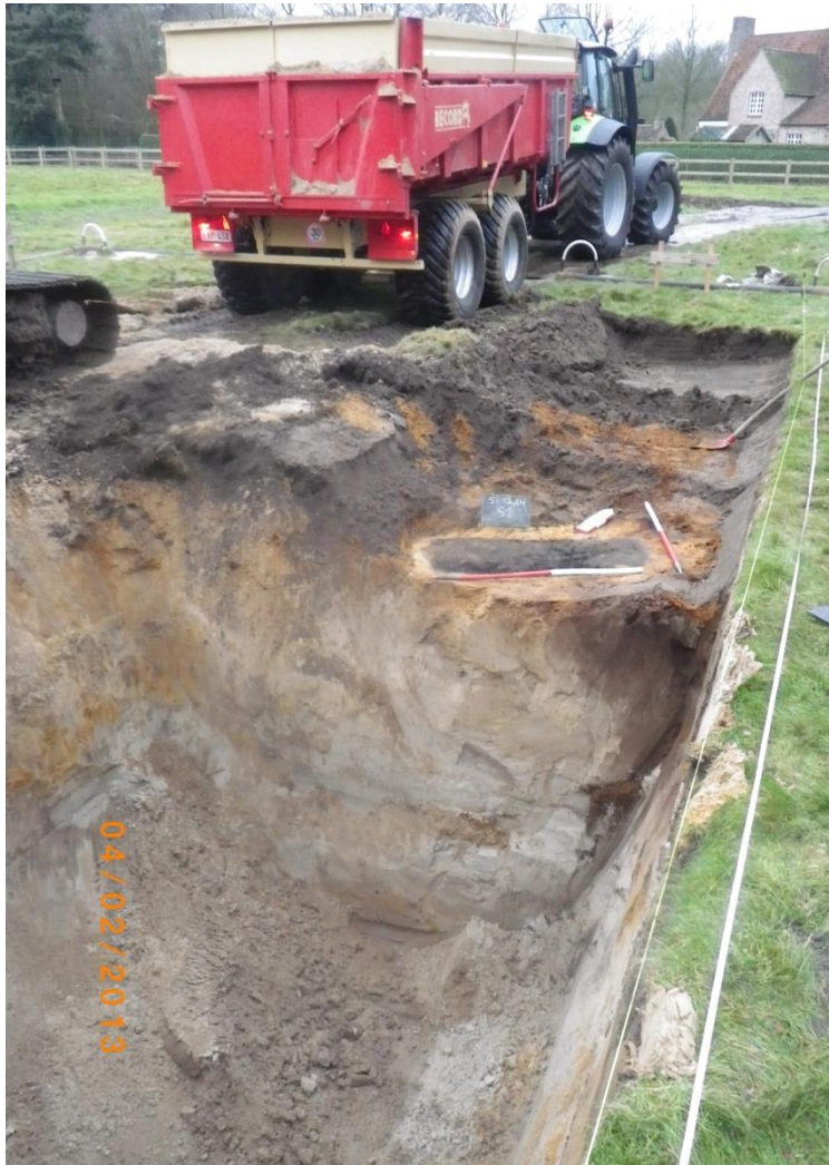
Figuur 5: Ligging van crematiegraf S1 binnen de bouwput