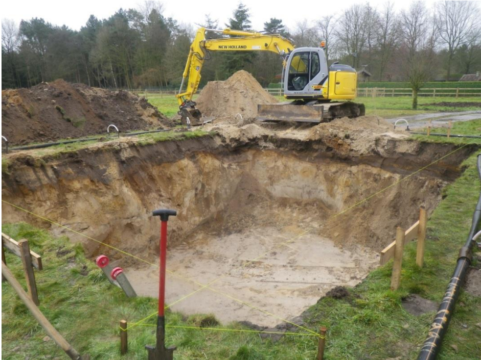
Figuur 9: Zicht op de definitieve bouwput