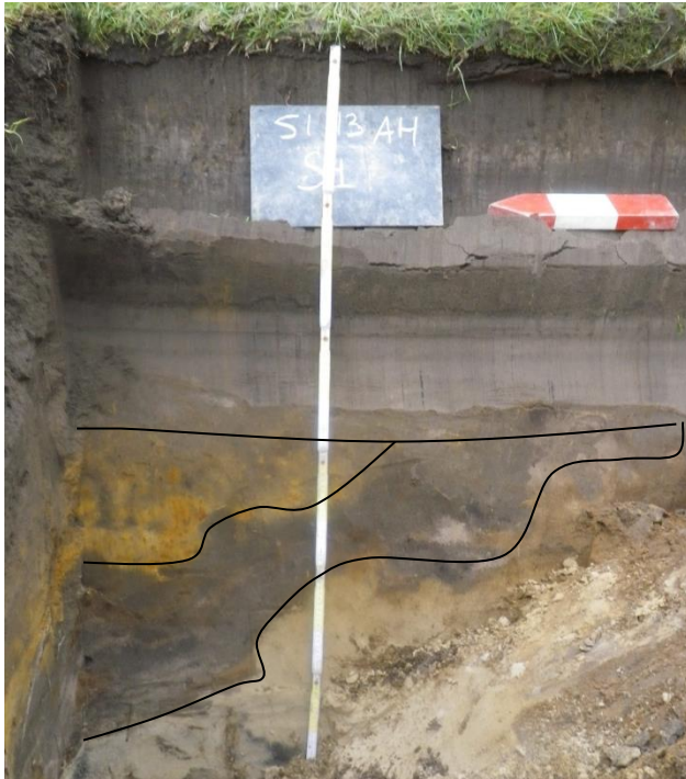
Figuur 8: Gracht S4 in het oostprofiel

Spoor 4 bevindt zich grotendeels in de noordelijke wand. Het betreft een ondiepe gracht. Deze gracht werd waarschijnlijk in twee fasen gedicht. De jongste fase bevat voornamelijk moederbodemmateriaal. Er werd geen diagnostisch materiaal teruggevonden.