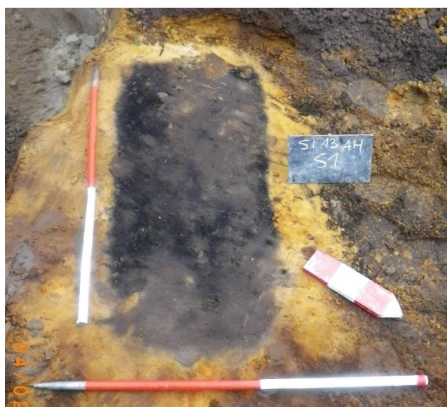
Figuur 3: Crematiegraf S1

Spoor 1 bestaat uit een zeer houtskoolrijke grafkuil met rechthoekige vorm en meet 115cm op 50cm. De kuil is NO-ZW georiënteerd. Wegens tijdsgebrek werd dit spoor in de lengte gecoupeerd en niet in kwadranten. Het spoor is ondiep bewaard, tussen 14 en 8cm. Vervolgens werd het spoor volledig bemonsterd.