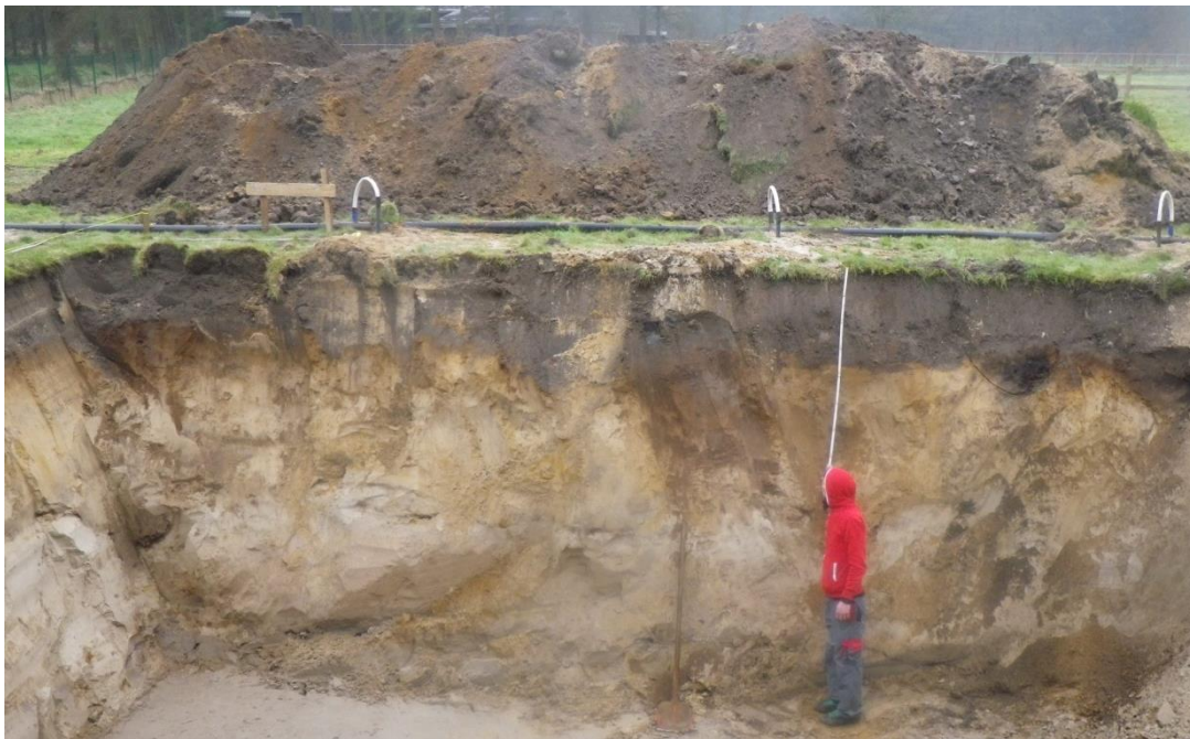
Figuur 10: Zicht op de bodemopbouw: zandbodem met verbrokkelde ijzer en/of humus B horizont (Zch)