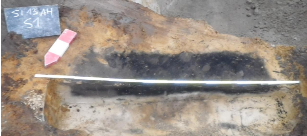
Figuur 4: Coupe op crematiegraf S1