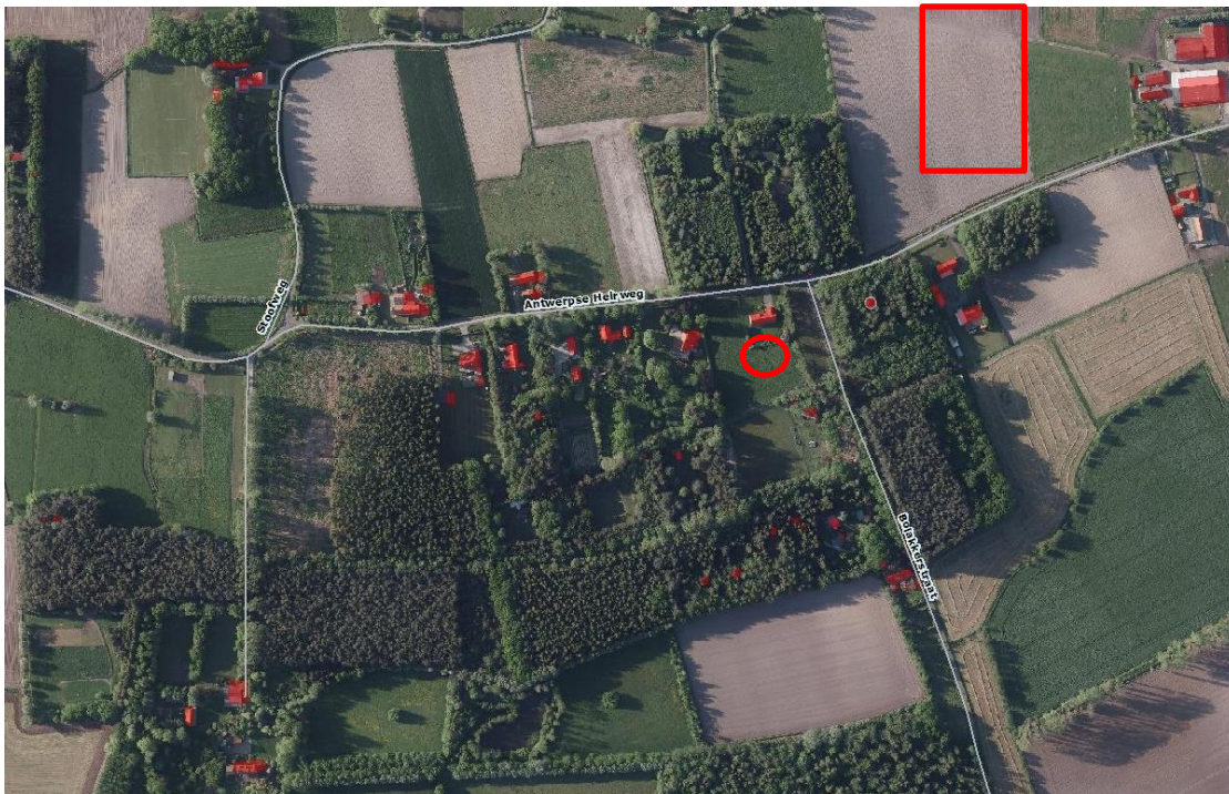
Fig.2: Luchtfoto van de omgeving van de vindplaats. Ovaal: vindplaats, Rechthoek: 2 e eeuwse nederzetting.