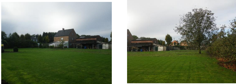
Figuur 5: Het te onderzoeken terrein.

Het onderzoeksgebied bevindt zich in een mooi aangelegde tuin. Eén zone is wegens de sloop van bijgebouwen grondig verstoord. Op de locatie van de 3 andere loten wordt op de locatie van de nieuw te bouwen huizen een sleuf aangelegd. Op deze manier konden verspreid over het terrein 3 proefsleuven worden aangelegd.