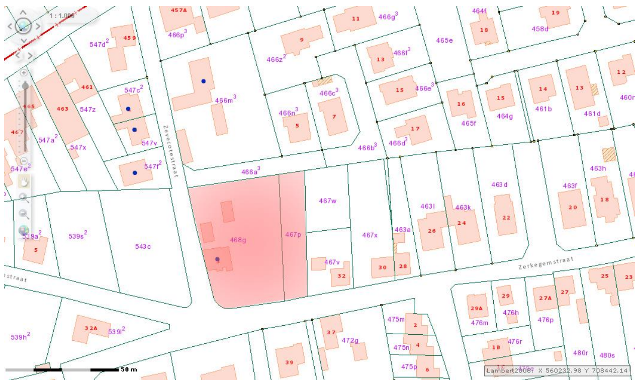
Figuur 1: Het projectgebied op de kadasterkaart.