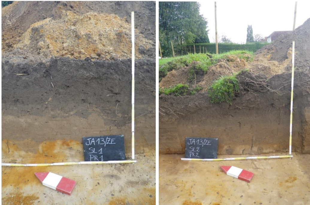
Figuur 4: Profiel in de sleuven 1 en 2.