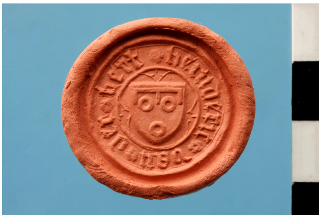
Fig. 8 : Afdruk Zegelstempel van Heinderic van der Hert