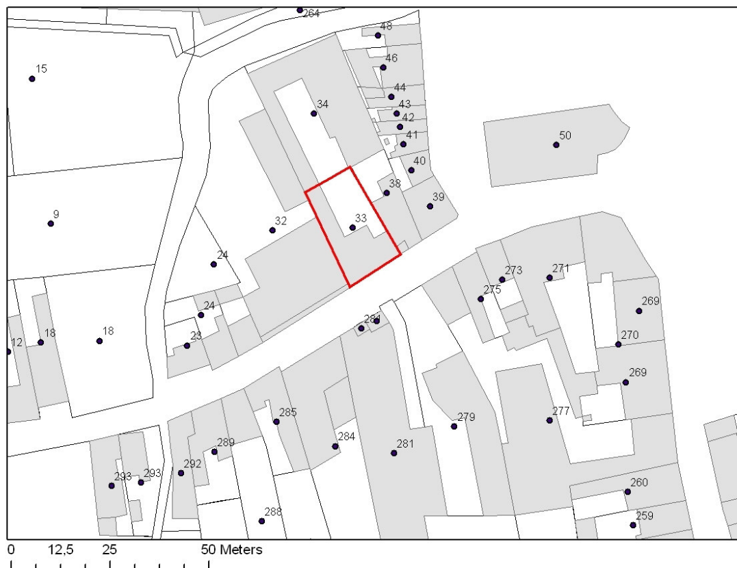
Fig.1 : Kadastraal plan

De site is gelegen op de rechteroever van de Schelde op een tot aan de rivierbedding reikende zandlemige kouterrug. De site zit samen met de Sint-Ursmaruskerk hydrografisch ingesloten tussen de Schelde en de Zwarte Beek die ten noorden van de dorpskern samen met de Grote Beek in de rivier uitmondt.