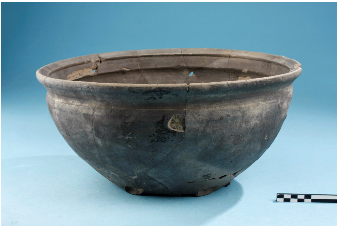
Fig. 6 : Kom in reducerend gebakken aardewerk (eerste helft 14 de eeuw) teruggevonden in de greppel aan de straatzijde