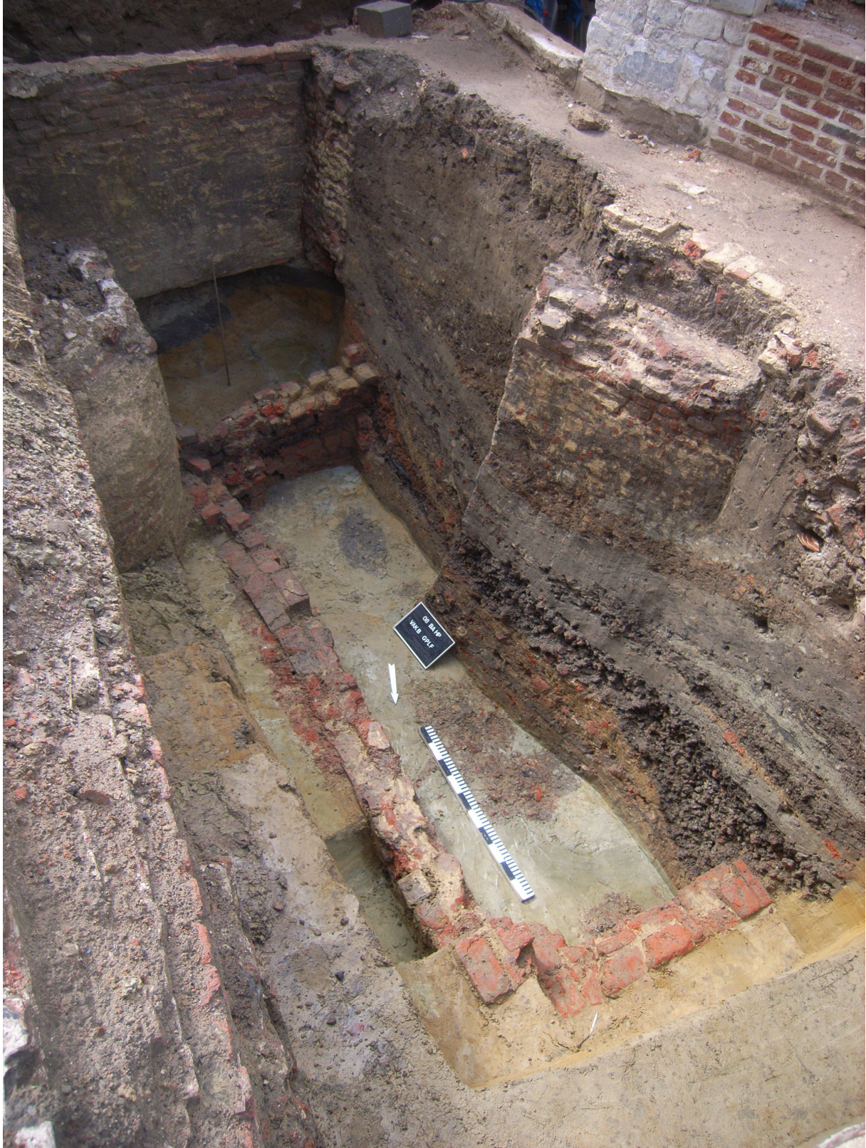
Fig. 4 : Baksteenfundering van de middeleeuwse kelder en keldervulling met pakketten verbrande leem.