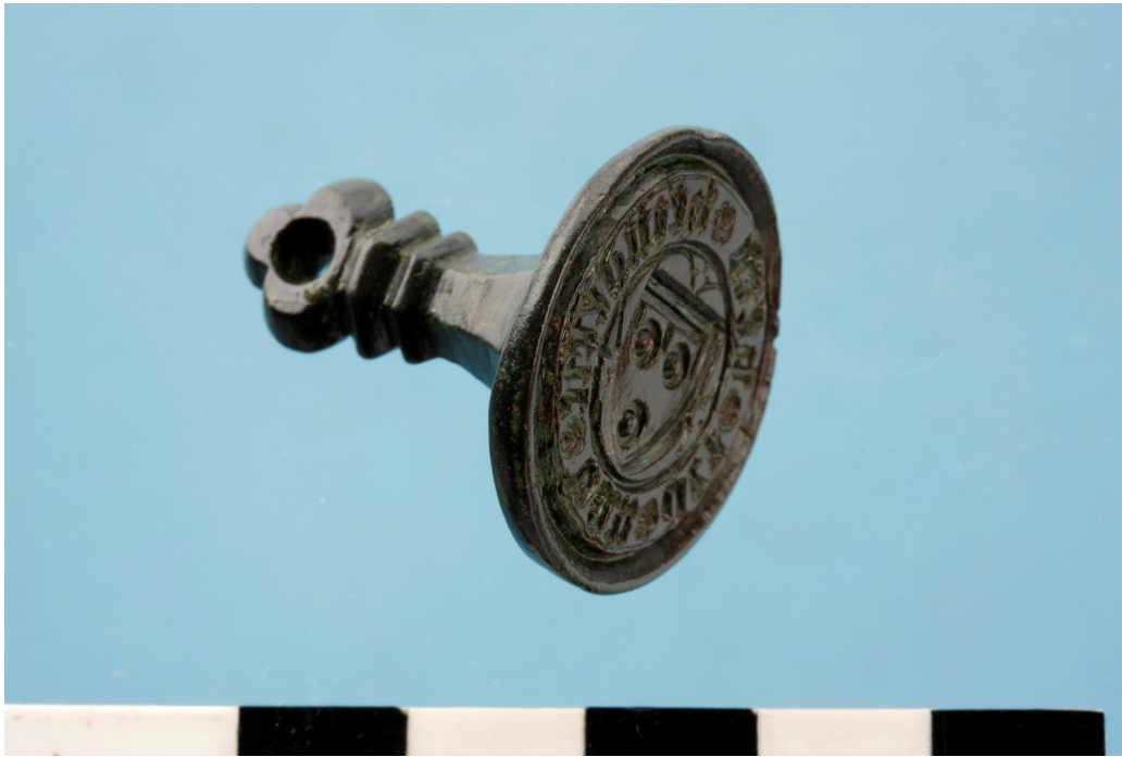
Fig. 7 : Zegelstempel van Heinderic van der Hert