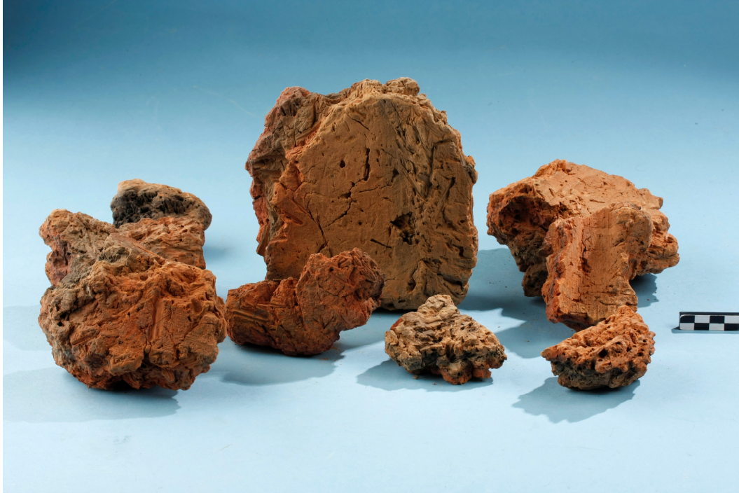
Fig. 5 : Fragmenten verbrande hutteleem