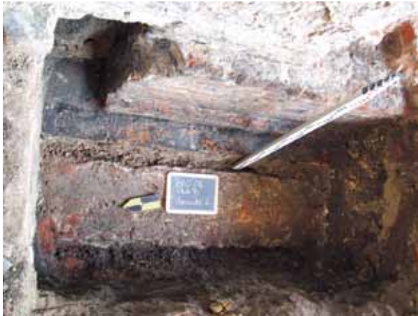
afb. 5: Vlak B: oudere bakstenen muur onder de tegelvloer

Vlak E vertelde in grote mate hetzelfde verhaal als vlak D. Er werd eveneens een doorsnede ingeplant haaks op het witstenen uitspringende deel. Zowel het gootje als de bovenste versnijding van de westelijke muur waren zichtbaar, net als de tegelvloer in Doornikse kalksteen. In het oosten van het vlak zaten een paar gebakken bruine tegels (6.84 T.A.W.) (afb. 8).