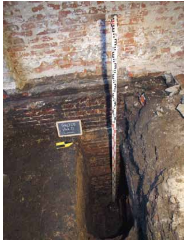
afb. 7: Vlak D: zicht op de westelijke muur met versnijdingen (Stad Gent, Dienst Stadsarcheologie)