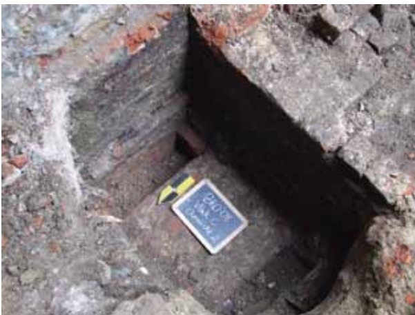
afb. 6: Vlak C: zicht op de oudere muur onder de zuidelijke muur van het Brouwershuis