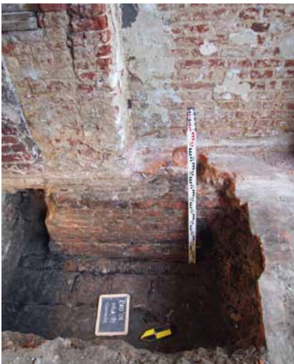
afb. 4: Vlak B: zicht op de deuropening in de oostelijke muur, de versnijdingen en de natuurstenen tegelvloer (Stad Gent, Dienst Stadsarcheologie)

Vlak C werd ca. 1.80 m naar het zuiden uitgezet op de plaats waar de zuidelijke gevel van het Brouwershuis moet geweest zijn (afb. 6). Onder de huidige vloer werd een in de oostelijke muur ingewerkte oost-west lopende muur – de zuidelijke muur van