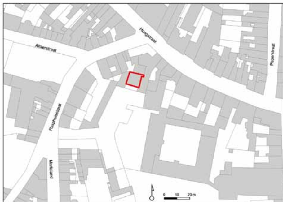
afb. 1: Situering van het Brouwershuis (Stad Gent, Dienst Stadarcheologie)

Na de nodige stutwerken met een uitgebreide stel-lage, was de zone voor archeologisch onderzoek beperkt tot een ca. 1.5 m brede zone langsheen de oost- en de westelijke muur. In het kader van reeds afleesbare littekens en sporen op de muren werden in totaal acht vlakken uitgezet (A, B, C aan de oostzijde, D, E, F, G en H aan de westzijde) (afb. 2).