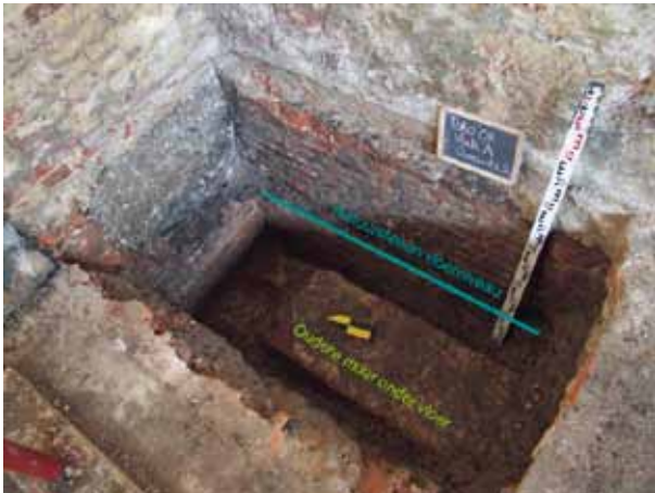
afb. 3: Vlak A: zicht op de oudere noord-zuid lopende bakstenen muur, onder de natuurstenen tegelvloer

muur waargenomen worden op 6.73 T.A.W. Ook hier was het door de beperkte omvang van het vlak niet mogelijk de aanlegdiepte te bereiken (afb. 5).