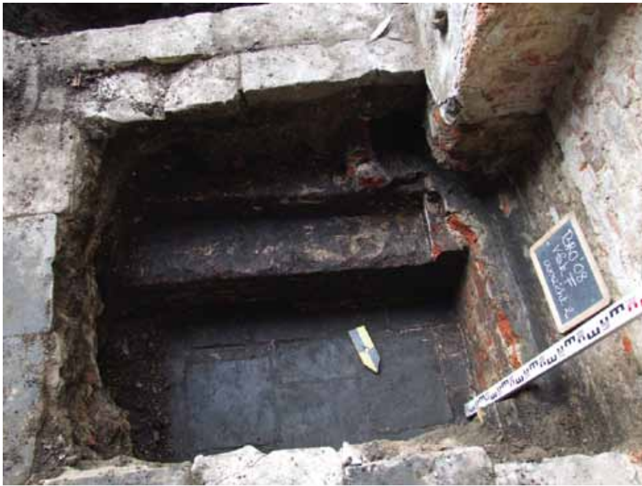
afb. 9: Vlak F: zicht op de bakstenen versnijding van de zuidelijke muur van het Brouwershuis en de natuurstenen tegelvloer