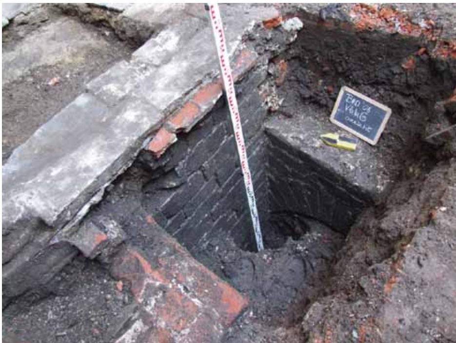
afb. 10: Vlak G: buitenzijde met uitbouw in witsteen