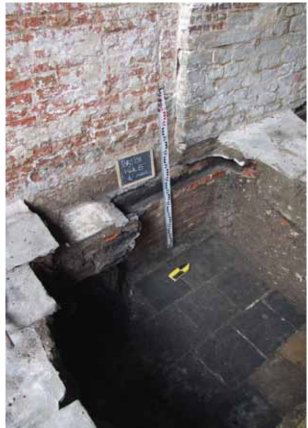
afb. 8: Zicht op vlak E (Stad Gent, Dienst Stadsarcheologie)