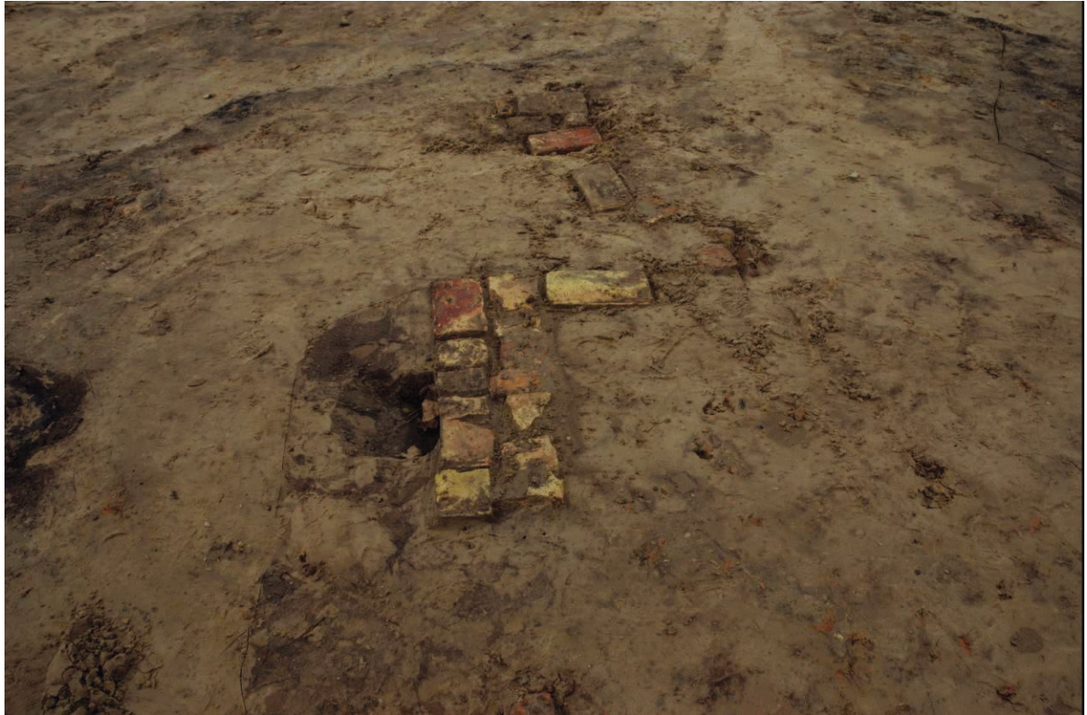
Restanten van het metselwerk van de ? centrale haard