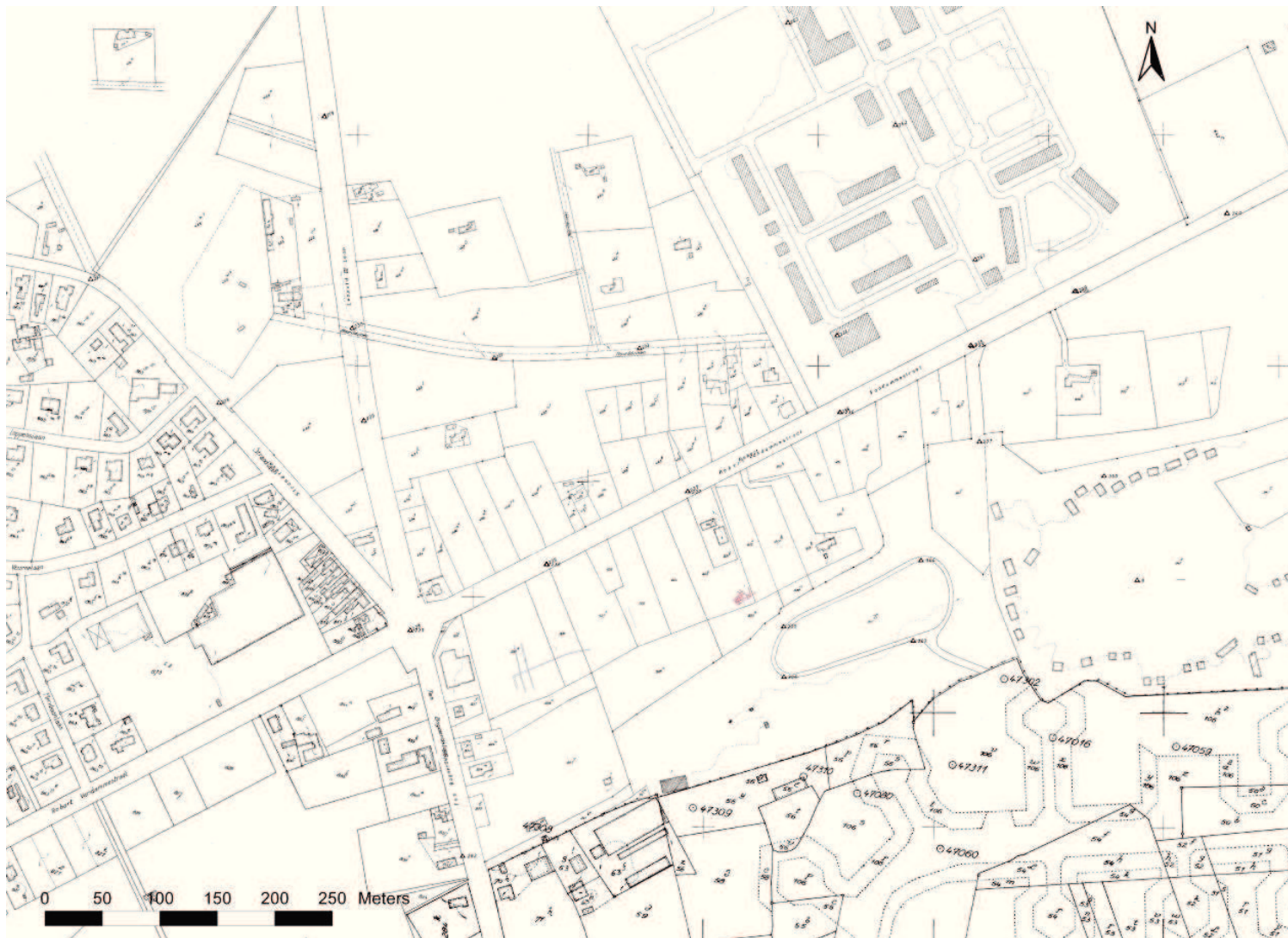
Kadasterkaart: \pm 1/4000 , \pm 1/390