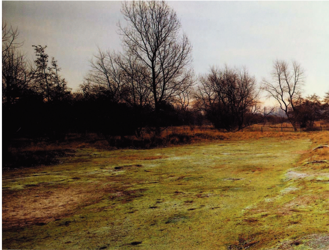
Resten van 19de-eeuwse duinakkertjes langs de Vandammestraat in Koksijde.

Duinakkertjes: Termote (red.), Tussen land en zee. Het duingebied van Nieuwpoort tot De Panne, 1992, Tielt