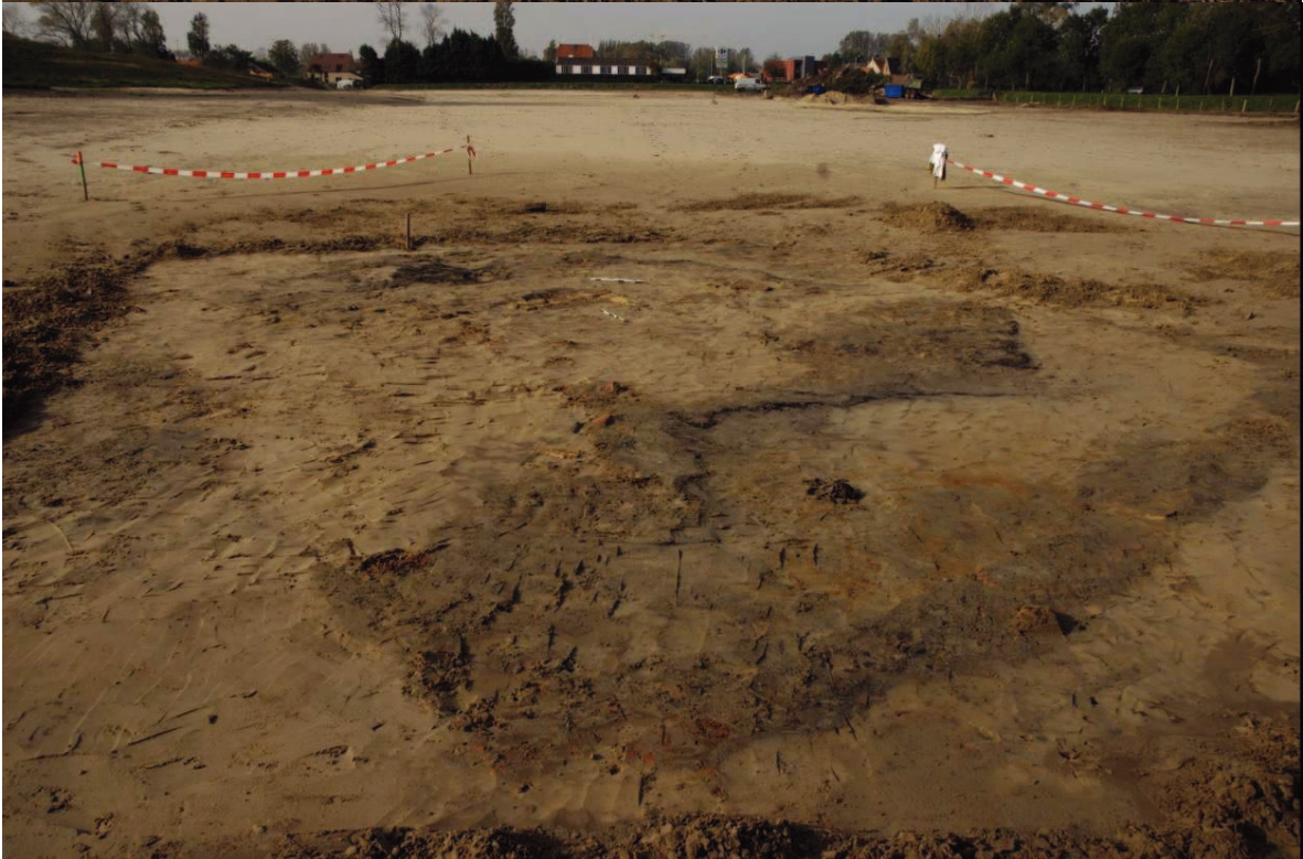
Contouren van de bewoning met uitbraaksporen en haardvlekken.