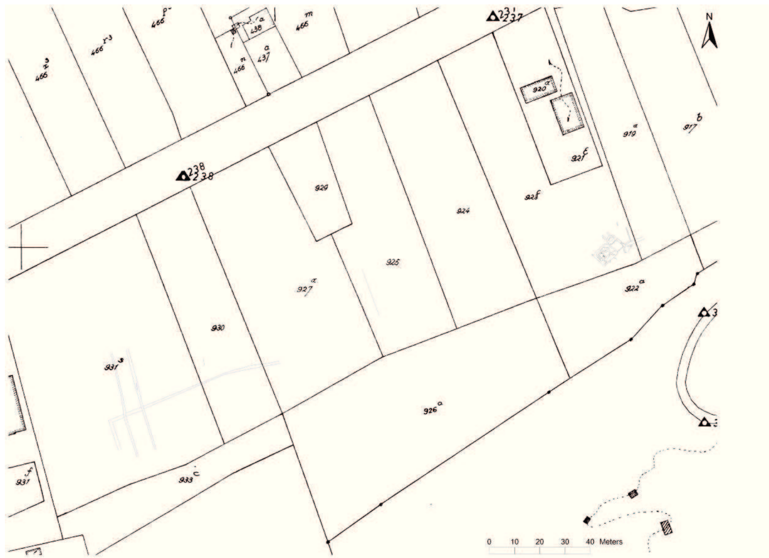
Grondplan van de geregistreerde sporen