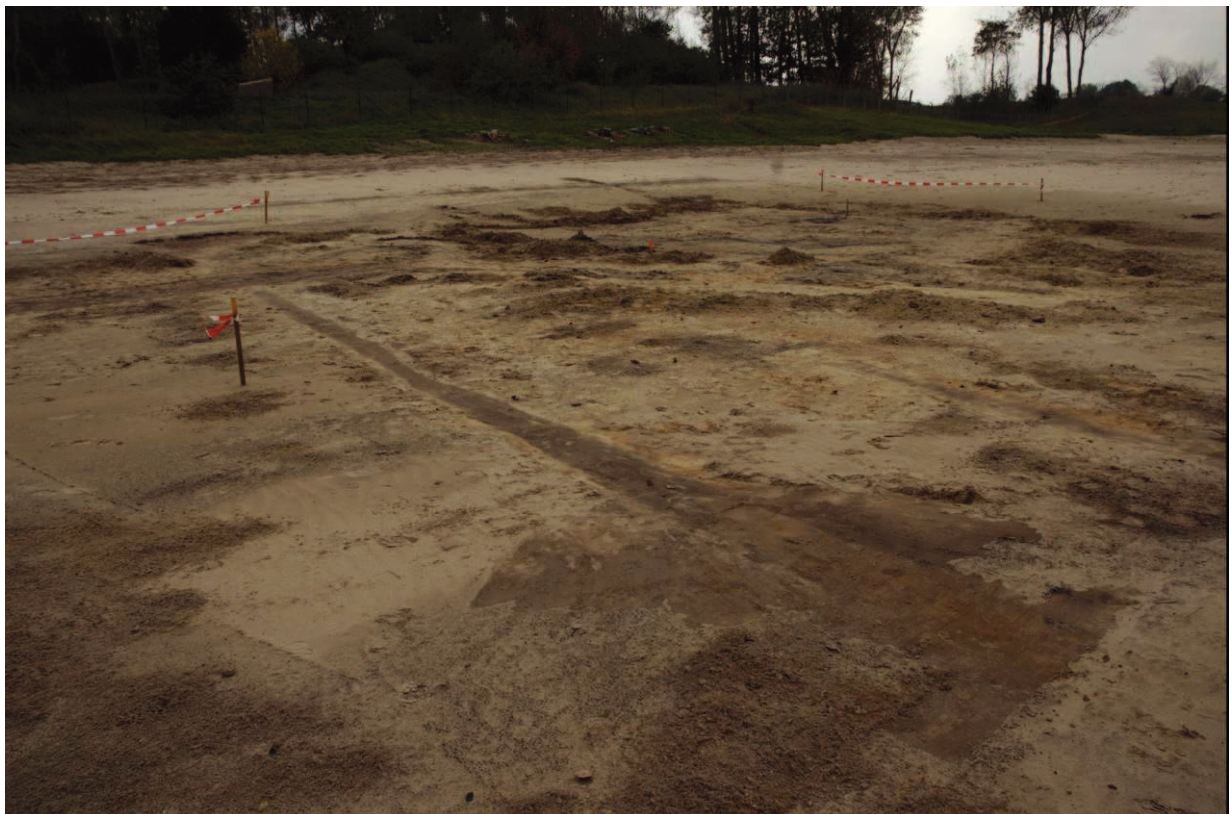
Greppels als afboording van duinenakkertjes