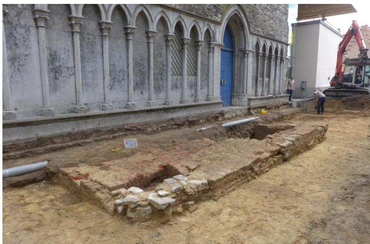
Fig. 1: De grafkelder voor de kapelingang. Voor het bijwerken of dichtmaken van de ingang op de hoek vooraan werden vervangen gevelornamenten gebruikt..

Over een 6 m brede strook werd voor de westgevel gegraven, ca. 42 m lang. Een bundel leidingen liep op ca. 5 m evenwijdig met de gevel en ook vlak tegen de gevel zorgde een recente afvoerbuis voor een verstoring. Bovendien werd de tussenliggende 4,5 m op enkele plaatsen door dwarse leidingen verstoord.