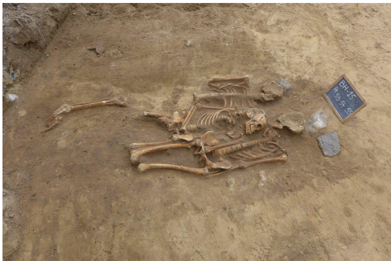
Fig. 2: Bijzetting van drie individuen met een steen aan het hoofd. (Stad Gent, De Zwarte Doos, Stadsarcheologie).

kistbegraving gaat. S2 lag met de voeten in het westen. Het hoofd was door de aanleg van de regenafvoer verdwenen. De armen waren gekruist op het bekken, links op rechts en de benen gestrekt. Ook hier verraden houding (het verschoven rechter onderbeen) en enkele verroeste spijkers een kistbegraving.