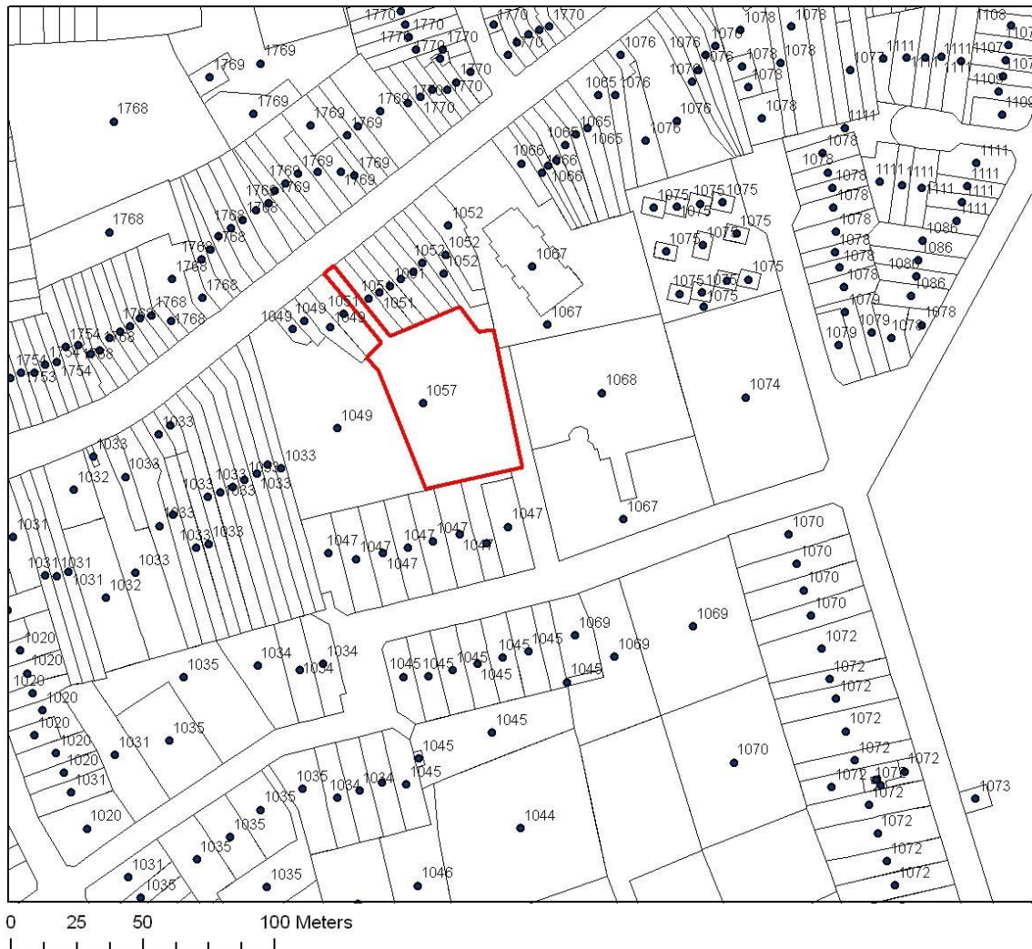
Fig. 1 Kadastrale kaart met aanduiding van de vindplaats in het rood.

Voor de precieze locatie van de bunkers verwijzen we naar het verslag van AdAK in bijlage.